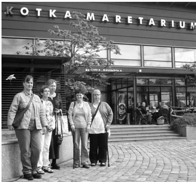
Työikäisten naisryhmä teki kesäretken invataksilla Kotkaan maanantaina 6.6 2011.