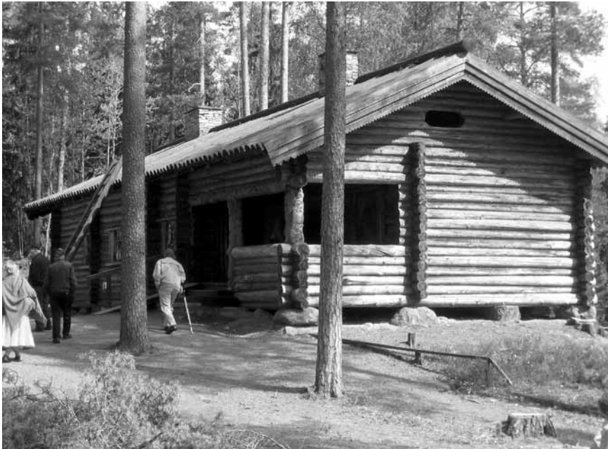
Marskin Maja on rakennettu (siirretty) kumpareiselle komealle hiekkakankaalle