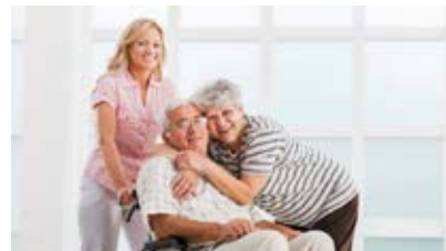
VOIMIA JA ENERGIAA VAPAISTA