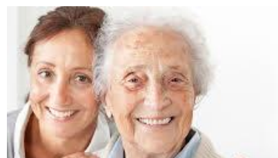
APUA KOTONA ASUMISEEN