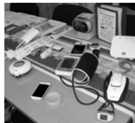
Esillä oli erilaisia arjen apuvälineitä

Teknologialainaamo on tarkoitettu omasta hyvinvoinnistaan kiinnostuneille aktiivisille senioreille. Se on kokeilupiste, jonne voi tul-