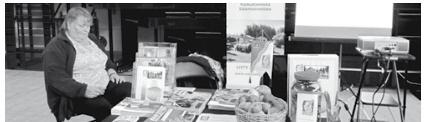
Vantaan Invalidit osallistui Hyvinvointimesseille. Messut järjestettiin 29.9.2012 Myyrmäen Energia Areenalla