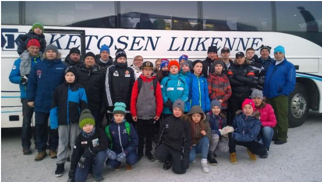
Lähdössä peruskoululaisten mestaruuskisoihin Poriin.