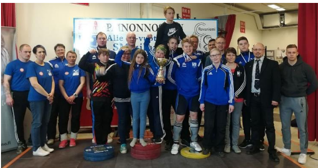
Alle 17-vuotiaiden SM-kisojen järjestelyporukka.