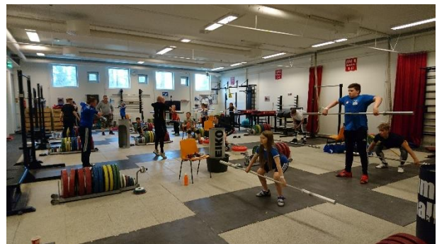
Junior Camp –painonnostoleirillä kesäkuussa.