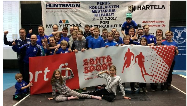
Rovaniemen voittoisa joukkue Porin Urheilutalolla.