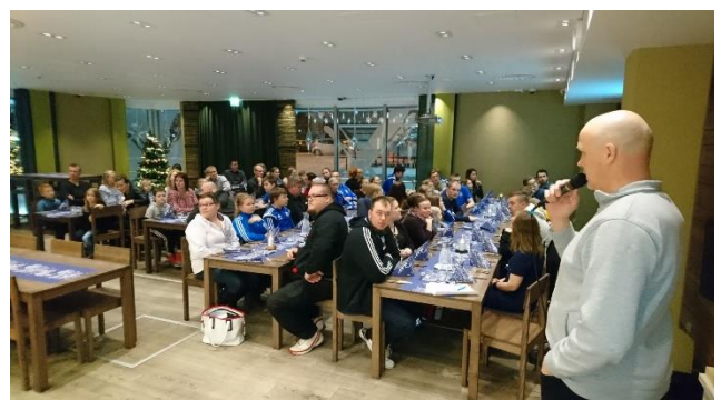
Seuran pikkujouluruokailuun osallistui yli 70 henkeä!