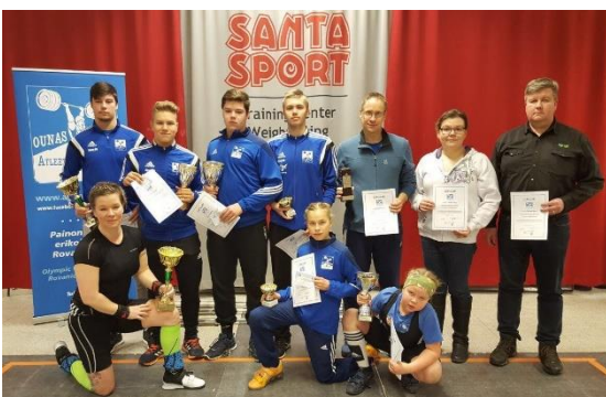
Vuoden 2017 palkittuja 2.12. kisojen yhteydessä.