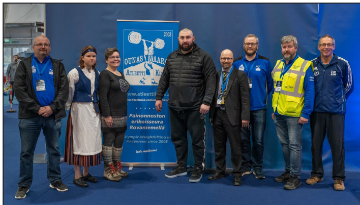
Lasha Talakhadze ja OAK