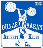
Kuva OAK Seurajoukkue- finaali- joukkueet Tampereella 26.11.2022