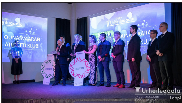
Tähtiseurakyltit ja vuoden lappilainen seura 2022