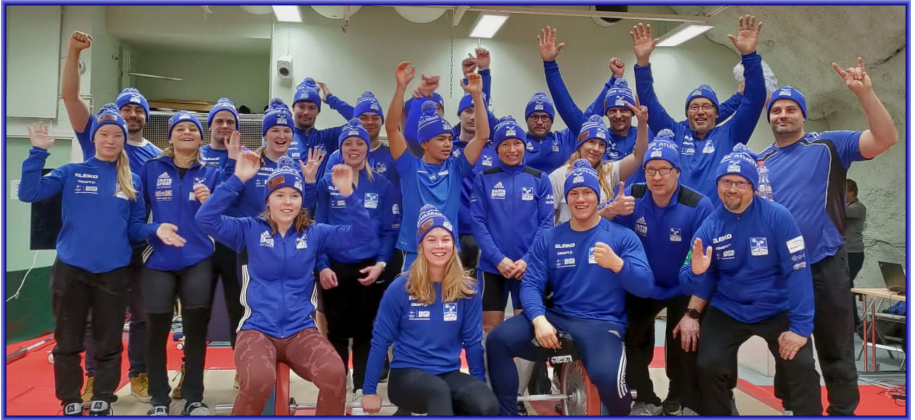
OAK Seurajoukkuefinaalijoukkueet Tampereella 26.11.2022