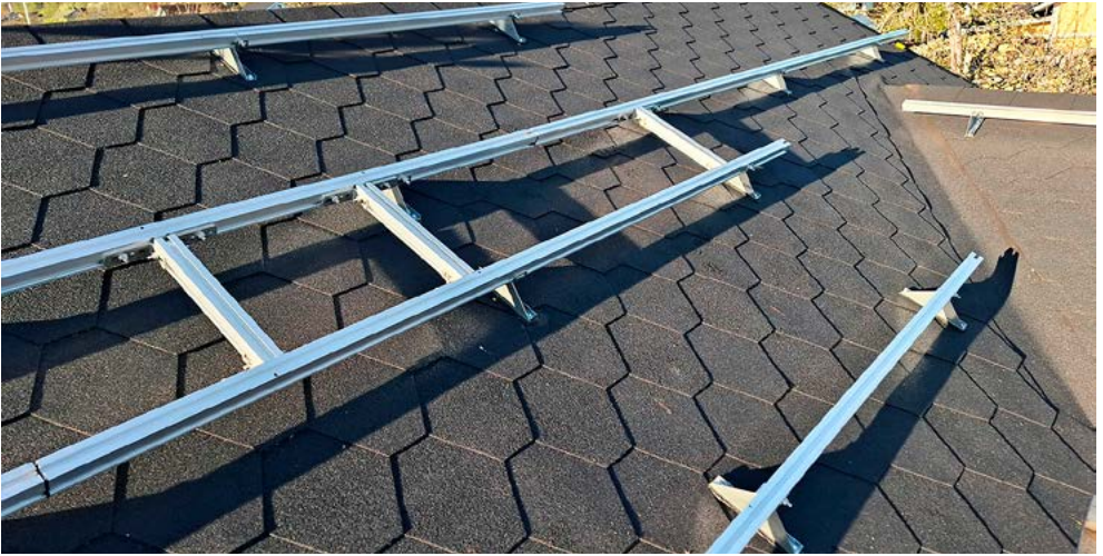
Uusitulle ja vahvistetulle katolle asennettiin kiskot paneelien kiinnitystä varten.