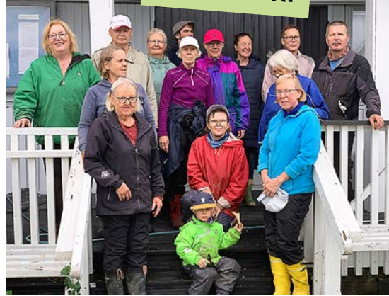
Yrttien porukkaa ympäristötalkoiden jälkeen syyskuussa 2025.

kerhotalolla järjestettiin koulutus vanhojen omenapuiden hoidosta. Kasveista ja muusta ajankohtaisesta voidaan keskustella myös Yrttien omassa WhatsApp-ryhmässä.