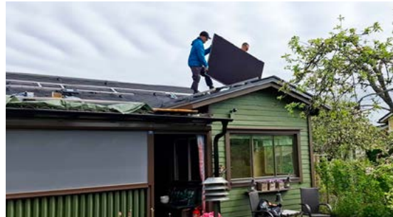
Ensimmäinen paneeli matkalla asennuspaikalle. Kuistin katolle asennetut paneelit keräävät talteen aamun ja iltapäivän aurinkoenergian.

– Ylijäämä sähkö siirtyy yhdistyksen sähköverkkoon. Tästä ei makseta korvausta, joten