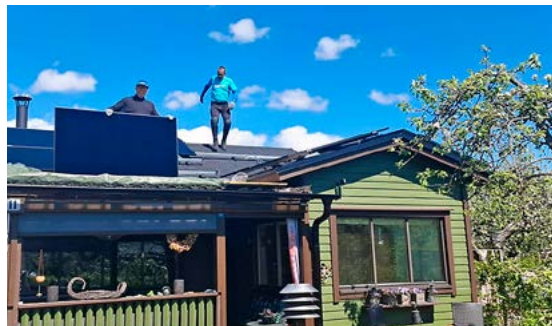
Asennustiimi työn touhussa.