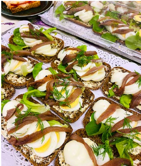
Muna-anjovisleivät ovat kahvilan toivelistalla.