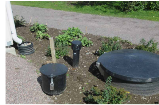
Uuden huoltorakennuksen nurkalla on mahdollisuus päästä eroon nestemäisestä, mökkikohtaisesta WC-jätteestä. Putken aukaiseminen onnistuu iLOQ-avaimella.