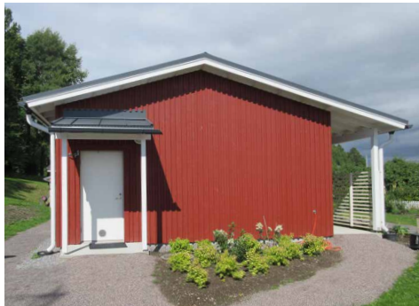
Pesulan ovi on huoltorakennuksen kerkotalon päädyssä.