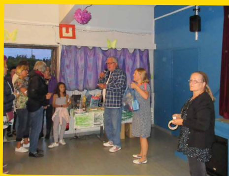
ARPAJAISTEN palkintojenjako oli jännittävä.