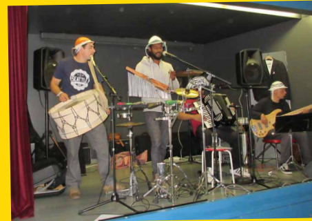
TRIO FORRÓZAR esitti brasilialaisia rytmejä.