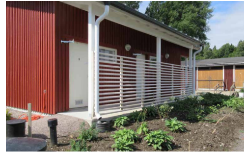
Suihkutilojen ovet ovat tien puoleisella sivulla. Vas. puoleisesta pääsee miesten suihkuun, oik. puoleisesta naisten suihkuun. Jotta suihkutilat pysyisivät siisteinä, on ulkokengät jätettävä oven ulkopuolelle.