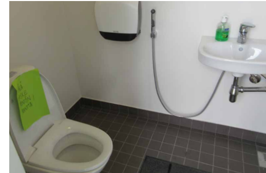
Näkymä WCstä. (Pieni vika pöntön kannessa lienee korjattu pian.)