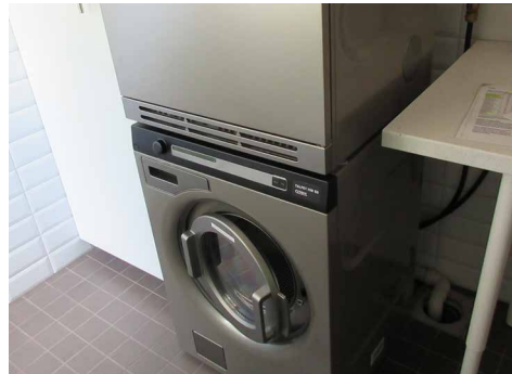
Pesukone tuntuu olevan pesulaluokkaa. Koneen päällä on kuivausrumpu.