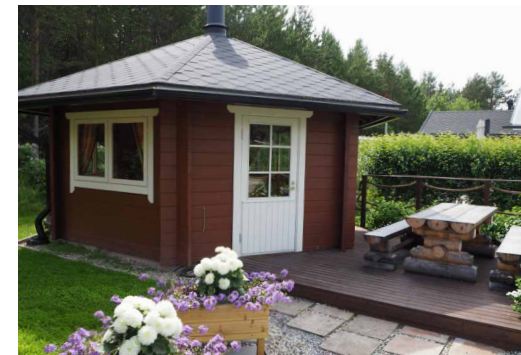
Kerhotalona toimii kota.

Yksi vihjekin tarttui mukaan. Eräs mökkilläinen oli maalannut lavakaulukset tervan ja pellavaöljyn sekoituksella. Kannattaa kokeilla kuitenkin omalla vastuulla.