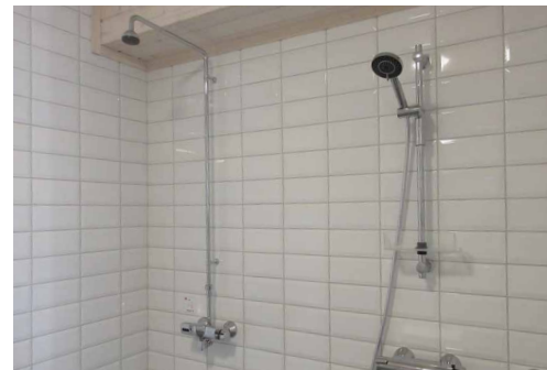
Suihkuhuoneessa on neljä suihkua. ↓