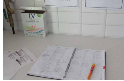
Pesulavuoro varataan kirjoittamalla tiedot varauskirjaan.