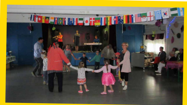
PUUTARHAN PERHEORKESTERI laulatti ja tanssitti.