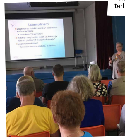
SUOMEN SIIRTOLAPUUTARHALIITON "Luonnollinen tuhoistorjunta" -kurssi pidettiin lauantaina 10.6.