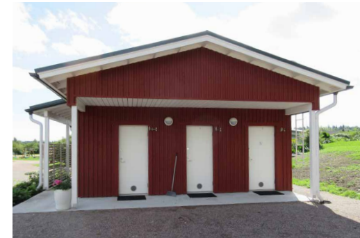
Uuden huoltorakennuksen vessat sijaitsevat vanhan huoltorakennuksen puoleisessa päädyssä. Kaikki kolme vessaa on tarkoitettu sekä naisille että miehille, oik. puolis on invavessa. Vanhan huoltorakennuksen kohdalla noudatetaan entistä käytäntöä: uuden huoltorakennuksen puoleiset kaksi vessaa ovat naisten vessoja ja rakennuksen toisella puolella sijaitsevat kaksi vessaa ovat miesten vessoja.