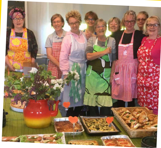
KESÄKAHVILAA pidettiin kesän aikana 12 kertaa. Kuvassa ensimmäisen kesäkahvilan talkoolaiset.