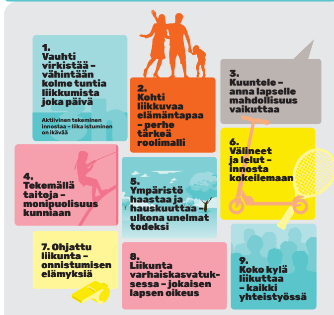
Varhaisvuosien fyysisen aktiivisuuden suositukset, 2016.

Varhaisvuosien fyysisen aktiivisuuden suositukset