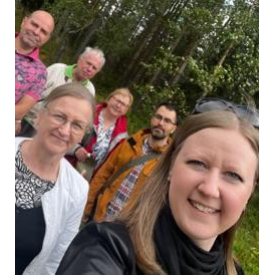
Lemin ruokatapahtumaan osallistujia.