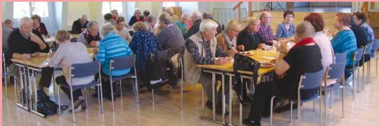
Messin syyspöydän antimista nautti Käpylän työväentalolla noin neljäkymmentä tyytyväistä ruokailijaa.