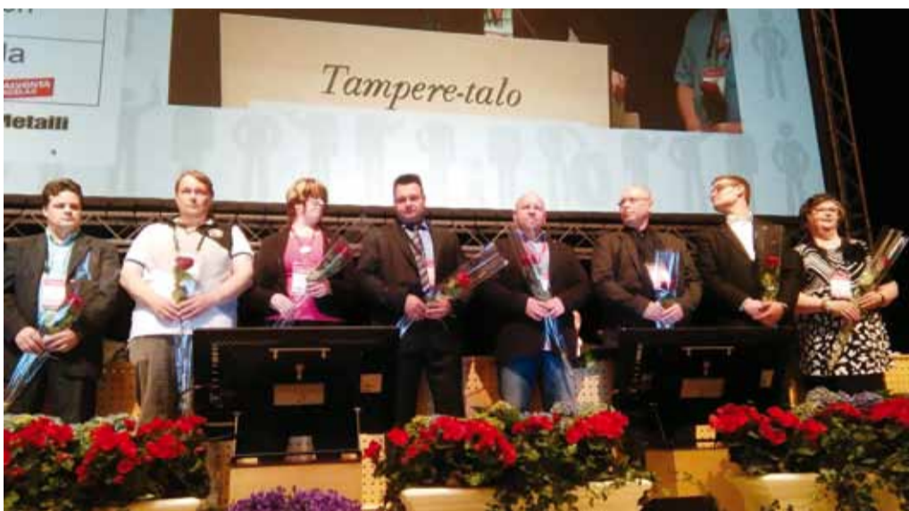
Uuden liittohallituksen jäseniä