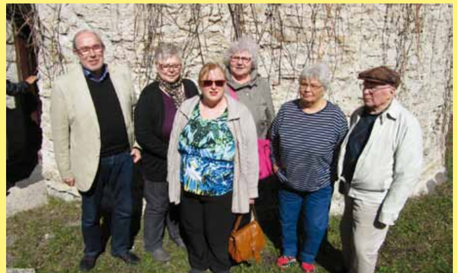
Seiskaseiskalaisia matkalaisia tuulimyllykahvilalla virkistäytyneinä.

Matkan varrella on runsaasti nähtävää, joten taukoja pidettiin useampia. Viron historiaan liittyvät oleellisesti kartanot. Ensimmäinen pysähdyskohde oli Vihulan kartanmiljo. Kyseessä on nykyään lähinnä kylpylähotelli. Seuraavaksi tutustuttiin Pursen kartanoon, jota