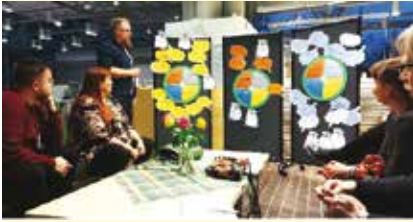
Ohjaajat tutustumassa päivän työskentelyn saldoon lauan-