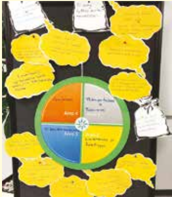
Ammattiosaston arvoista tuli tällainen taulu