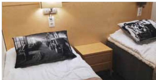
Tyynyissä Teollisuusliiton historiaa

Teollisuusliiton sivuilta pääset Murikan sivuille ja huomioi myös, että mikäli Tampereelle asti opiskelemaan lähtö tuntuu hankalalta, Murikalla on sivupiste