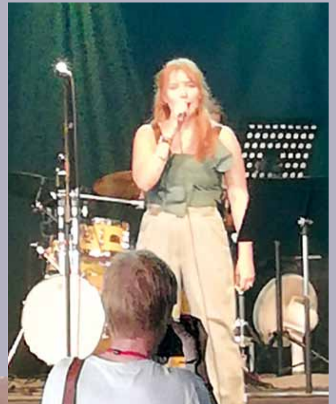
Yona yllätti työväenlauluilla