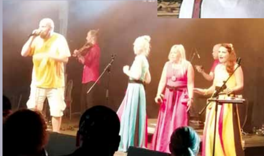
Palecafe ja Värttinä