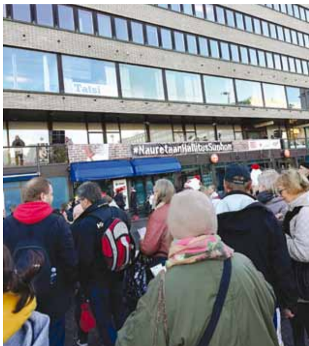
Stand-up komiikkaa ja työväenlauluja Hakaniemessä