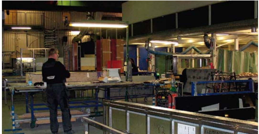
Merima sisustaa maailman loistoristeilijöitä.