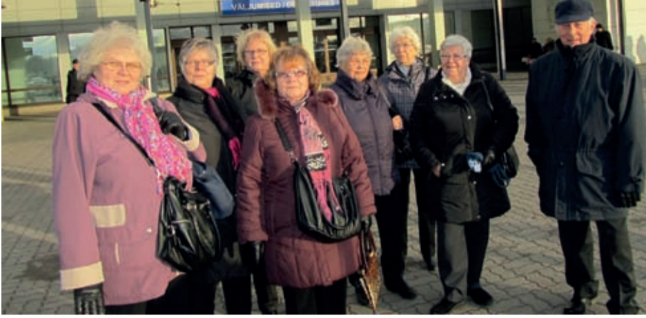
Seiska seiskan veteraaneja lähdössä tutustumaan Tallinnaan.