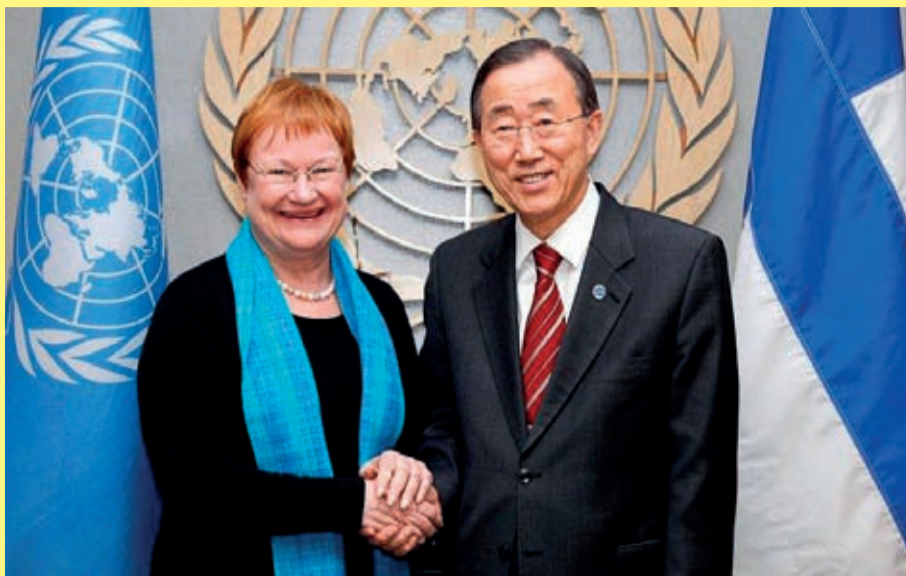
Presidentti Tarja Halonen on arvostettu asiantuntija kun puhutaan kestävästä kehityksestä. Hänen vetämänsä työryhmä teki YK:n pääsihteerin Ban Ki-Moonin toimeksiannosta aiheesta korkeantason raportin.

Korkean tason työryhmä edellyttää yleensäkin enemmän läpinäkyvyyttä tavaroiden ja palvelujen hinnanmäärittelyssä, jonka osana olisivat myös sosiaaliset ja ympäristötekijät. Päättökentekoa voi ohjata investointikannustimilla ja toisaalta haittaverolla, joilla kompensoidaan esimerkiksi