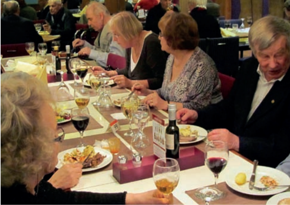
Laivan buffetpöytä oli runsas ja maittava.