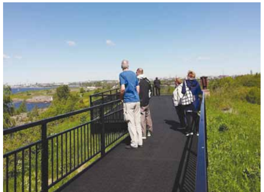
Hallituksen jäsenet maisemia ihailmassa