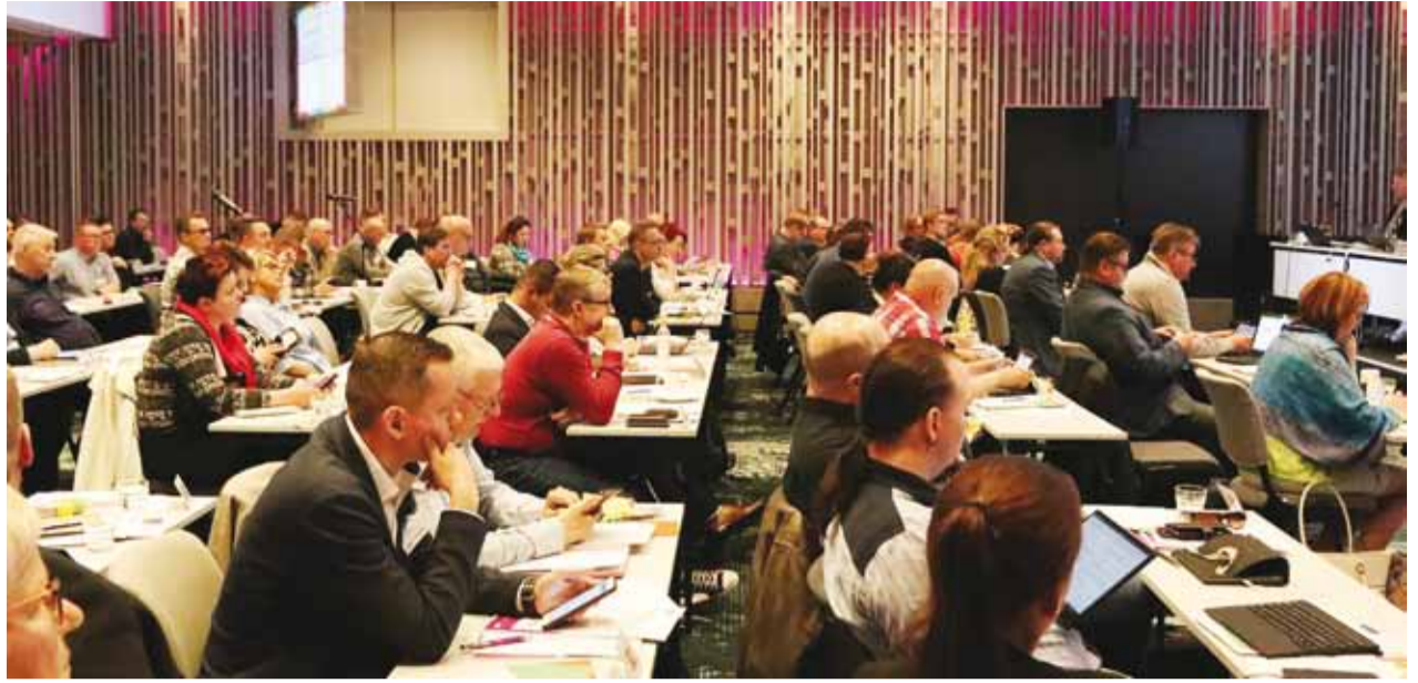
SAK-edustajisto, toukokuu 2019

SAK:n edustajisto oli koolla Helsingissä 16.- 17.5.2019 Edustajisto piti selvänä, että aktiivimalli on peruttava, siitä käytiin monta puheenvuoroa. Antti Rinne käväisi myös kokouksessa ja hänen kantansa aktiivimalliin oli aivan selvä; se pitää poistaa. Myös monet muut työelämään liittyvät asiat ovat agendalla, kun uutta hallitusta muodostetaan, kovaa vääntöä on monestakin asiasta, mutta toivotaan, että saamme maahan hallituksen, joka kuuntelee/kohtelee kaikkia kansalaisiaan tasapuolisesti. Tätä kirjoitettaessa hallitus ei vielä ole ”syntynyt”, mutta todennäköisesti, kun lehti on siinä, meillä on Suomessa uusi hallitus.