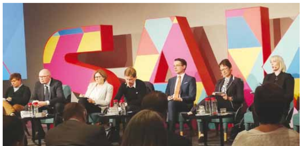
EU-paneeli SAK:n kokouksessa.

Palkansaajaliikkeen tehtävä on rakentaa ja puolustaa hyvää ja reilua työelämää koko Euroopassa. Sosiaalisen polkumyynnin sijaan tarvitsemme vahvempaa työntekijöiden suojelua. Euroopan parlamentti on kuluneella vaalikaudella parantanut lähetettyjen työntekijöiden asemaa ja rajannut nollatuntisopimusten käyttöä. Tällä tiellä on jatkettava.