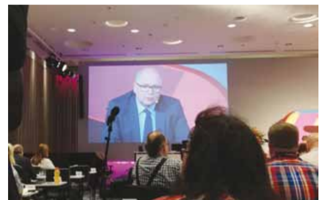
EU-vaalien äänikuningas Eero Heinäluoma

Työntekijöiden vaikutusmahdollisuuksia omaan työhönsä on lisättävä. Vain näin voidaan pidentää työuria. Työntekijöiden asenteiden ja toimintatapojen