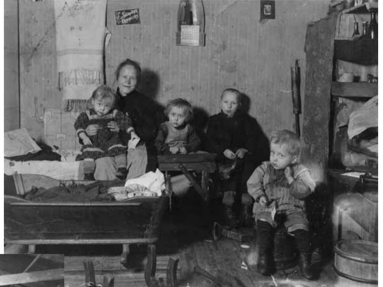
Pieniä, matalia, pimeitä ja kylmiä olivat työväen asunnot.

Pyykki pestiin pesutuvassa, joka oli leipomotuvan yhteydessä. Tavallisesti pyykkipäivä oli kerran kuussa, ja aika oli varattava isännöitsijältä. Kaupunki oli järjestänyt pyykinvutuslaitureita rantaan, jonne pyykkiä kuljetettiin käsirattailla tai kelkalla. Vuokrattavassa kamarissa piti olla hyvät huonekalut. Tannerit hankkivat ne huutokaupoista. Topatun sohvan edessä oli soikea petsattu pöytä.