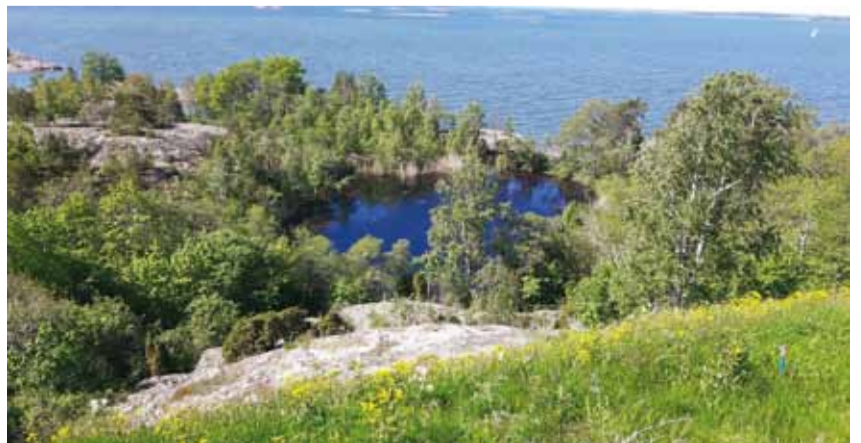
Yleisnäkymää Vallisaaresta merelle päin