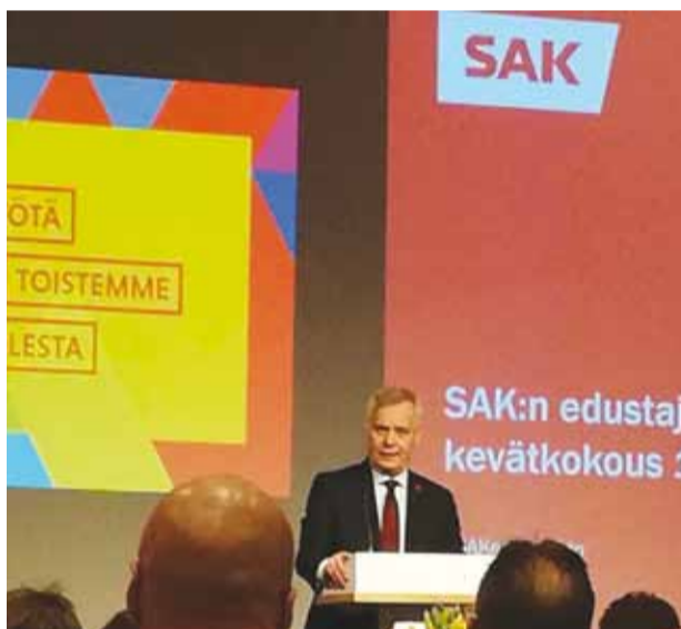
Antti Rinne SAK:n kokouksessa.

Työttömiä kuristavasta aktiivimallista on luovuttava. Toimeentuloturvan leikkaaminen ei aktivoi työttömiä työnhakuun tai osallistumaan palveluihin. Aktiivimallin leikkuri on osunut erityisesti vanhempiin työttömiin ja ansioturvan lisäpäivillä oleviin. Näistä vaikutuksista SAK on jo alusta asti varoittanut. Kun sosiaaliturvaa uudistetaan, työttömyysturva ja työttö-