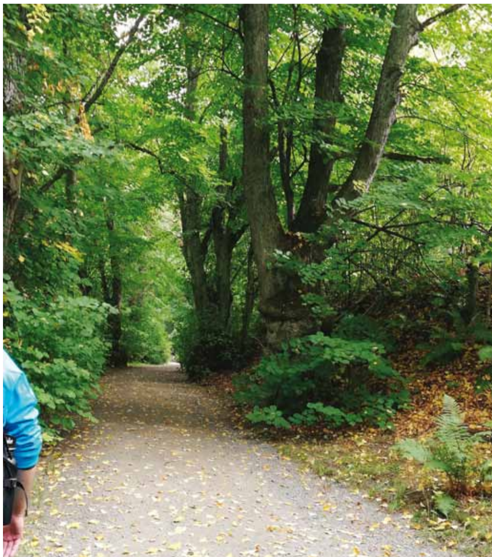
Täällä sanotaan päättömän everstin kummittelevan