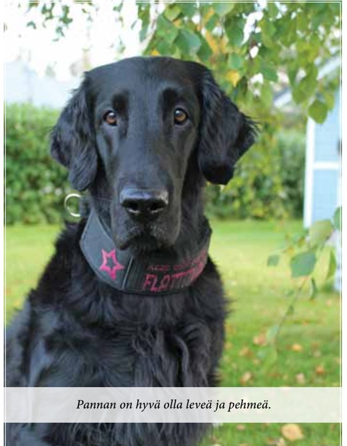
Pannan on hyvä olla leveä ja pehmeä.