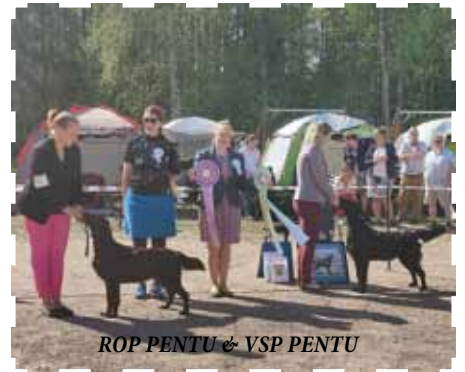
ROP PENTU & VSP PENTU