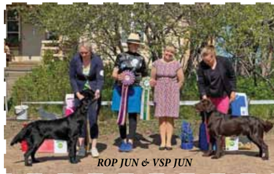
ROP JUN & VSP JUN