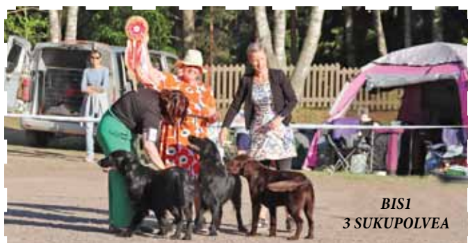
BIS1 3 SUKUPOLVEA