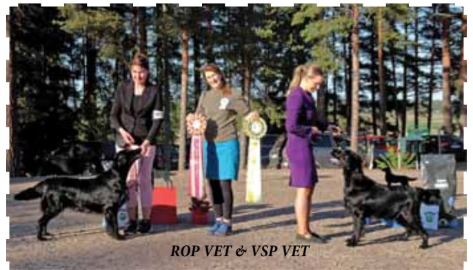
ROP VET & VSP VET