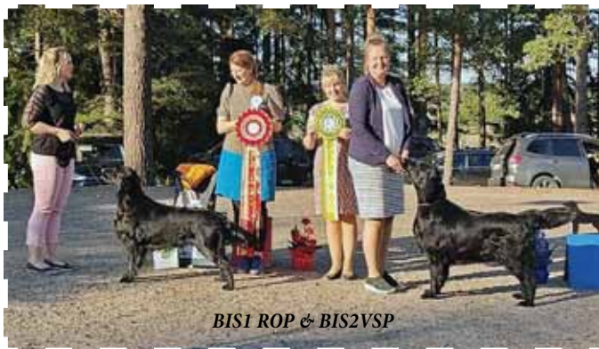
BIS1 ROP & BIS2VSP