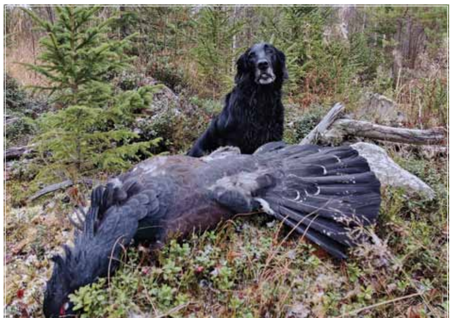
Kuva alla: Impin ja Saanan saumattoman yhteistyön tulos, Saanan ensimmäinen metso.

Nykyisellään perheeseemme kuuluu myös Korven Akan Punalintu "Miina" 5kk. Miinan tulon myötä Impi on oppinut uudelleen "leikkimään"!