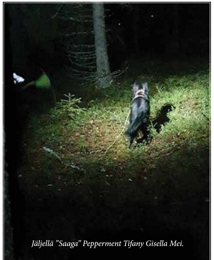
Jäljellä "Saaga" Peppermint Tiffany Gisella Mei.