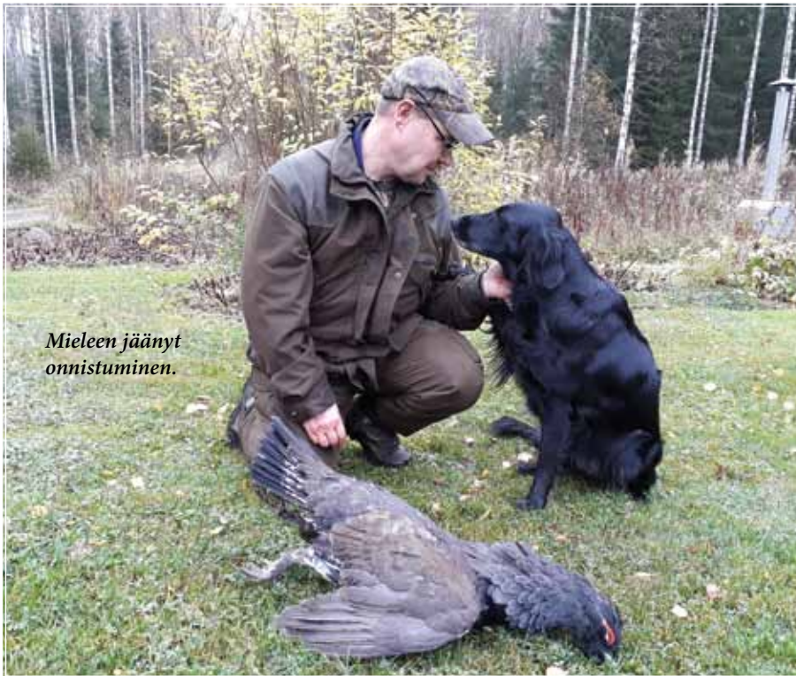
Mieleen jäänyt onnistuminen.

Elettiin kevättä 2011 kun rakkaat tyttäreni saivat päähänsä haluta koiran, siis minkä tahansa koiran. Olin lähdössä kalaan Ruotsiin ja sovimme vaimoni kanssa, että asian voi laittaa ns. vireille, mutta koiran tulisi olla noutaja ja mielellään juurikin sileäkarvainen-noutaja. Mahdollisesta varaamisesta päätettäisiin kuitenkin vasta palattuani reissusta.