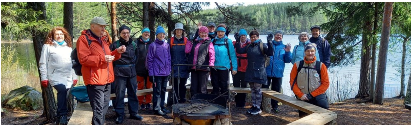
Kuva luontoliikkujapäivästä Repovedellä

Vastuualuejohtaja, vastuuvalmistelija, SOTE-rakennemuutos