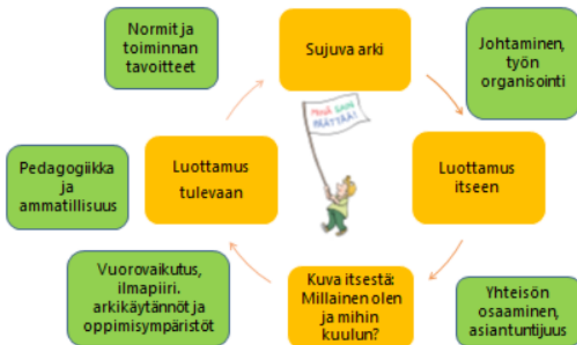
Kuva 4. Hyvinvoinnin kehä

Yhteisön toimintakulttuuria voidaan muuttaa ja kehittää (VASU 2016)