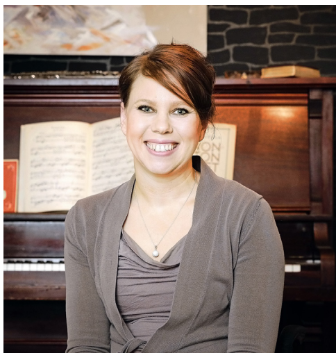
■ Hevosten maalaaminen lievittää ahdistusta, jonka ratsastuksesta luopuminen aiheutti.

Taudin oireisiin kuuluvat yliliikkuvien nivelten lisäksi närästys, tyrät, samettinen iho ja sydämen epäsäännöllinen syke.