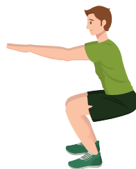
Kyynärpää ja polvi