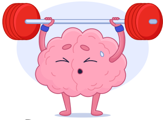
Peukku ja pikkurilli

Suorita yksi bingorivi eli kolmen suora sivusuunnassa ← →, viistoon ↖ ↗ tai pystysuunnassa ↑ ↓