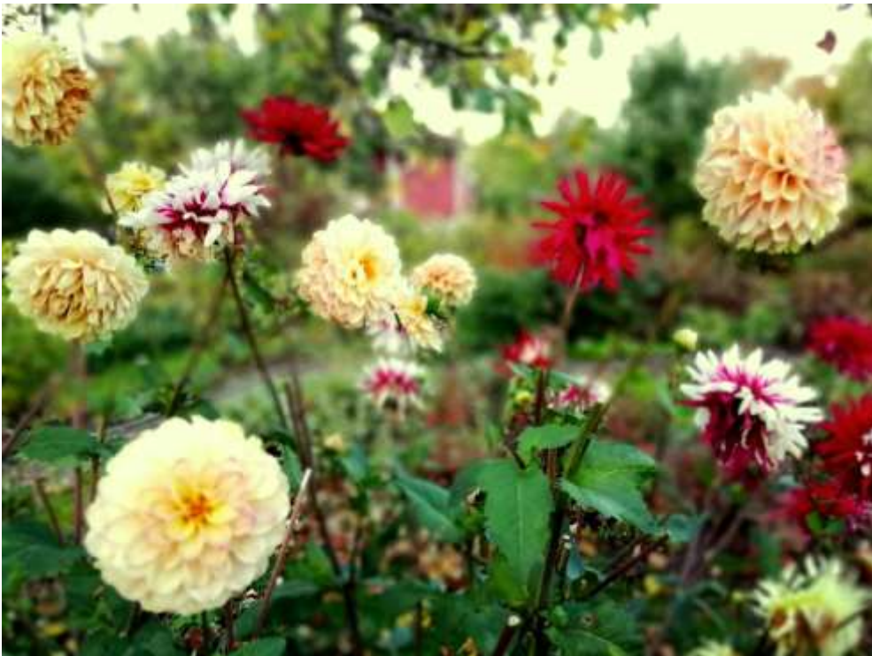
Kuva Eija Meriluoto

Koonnut ja kirjoittanut Tiina Pihlajamäki Helmikuu 2022