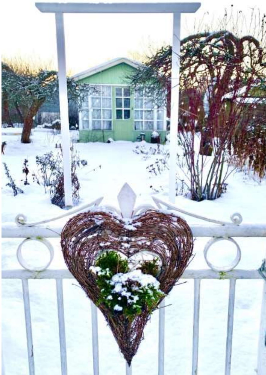
Kuva Tiina Pihlajamäki

“Kupittaaan siirtolapuutarhan siirtäminen muualle tarkoittaa käytännössä toiminnan siirtämistä. Siinä yhteydessä nykyinen alue, sen mökit ja palstat, puretaan. Silloin menetetään kulttuurihistoriallisesti ainutlaatuinen kokonaisuus, jonka ominaispiirteet eivät ole muualle siirrettävissä. Edellä oleviin viitaten Turun museokeskus toteaa omalta toimialaltaan, että Kupittaaan siirtolapuutarha tulee säilyttää nykyisellä paikallaan eikä sen alkuperäistä muotoa ja rakennetta tule muuttaa.” Lausunnon ovat allekirjoittaneet Turun museokeskuksen museopalvelujohtaja Olli Immonen sekä kulttuuriperintöyksikön intendentti Maarit Talamo-Kemiläinen.[45]