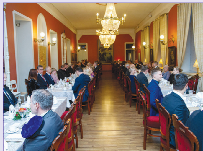
Upseerikerho loi upeat puitteet vuosijuhlalle

Vuosijuhlassa jaettiin myös Insinööriliiton hallituksen myöntämiä pronssisia ja hopeisia ansiomitalia aktiiveillemme, jotka ovat omalla toiminnallaan mahdollistaneet yhdistyksemme toiminnan muun