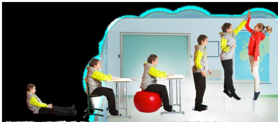
Etelä-Karjalan Liikunta ja Urheilu ry

→ Koulun ja kunnan tukeminen kohti liikkuvampaa ja aktiivisempaa koulupäivää