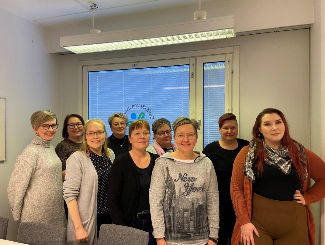
Etelä-Savon Jyty ry:n hallituksen väkeä järjestäytymiskokouksessa 21.1.2023