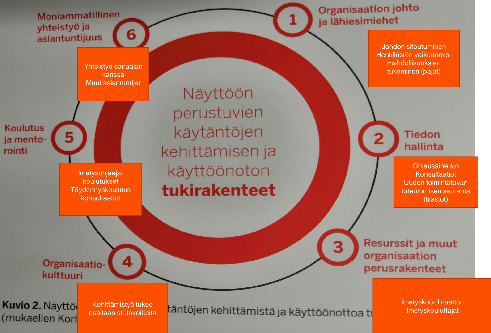
Kuvio 2. Näyttöön perustuvien käytäntöjen kehittämisen ja käyttöönoton tukirakenteet (mukaellen Korhonen ja Kumpulainen 2010)