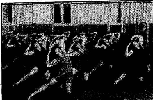
Harjoitusiltaan pohjoisessa kansakoulussa (1920-luku)

Harjoitusilloissa ohjelmassa olivat voimistelu, telinekkeet, plastiikka, laululeikit, kansantanssi ja palloleikit. Lisäharjoituksia oli keväisin urheilumerkkivaatimusten vuoksi. Esiintymisjoukkueet valmistelivat iltamia.