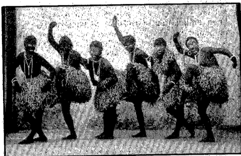
Ne kuuluisat "nekerit" vuodelta 1935.