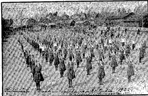
Maakuntajuhlilta Riihimäellä 1923.

Lastenjuhlat saavuttivat suuren suosion. Pääsyliput olivat usein ennakolta loppuunmyytyjä. Ohjelmissa vaihtelivat soitto, yhteislaulu, satunäytelmät, kertomukset, perhos-, keiju- ja tonttuleikit sekä yksin- ja ryhmätanssit ja jopa nk. penkkivoimistelut. Vierailijoina kävivät Yleisradion Tarja-Tuulikki, Helsingin Oopperan lapsibaletti, Mikki Hiiri ja Susihukka, kanaperhe ja Pessi ja Illusia. Väliajoilla ongittiin ja pyörätettiin onnenpyörää.