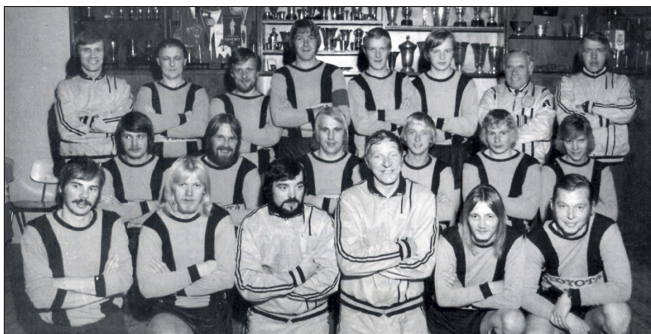
Kauden 1973 päätteeksi II divisioonaan nousut joukkue.