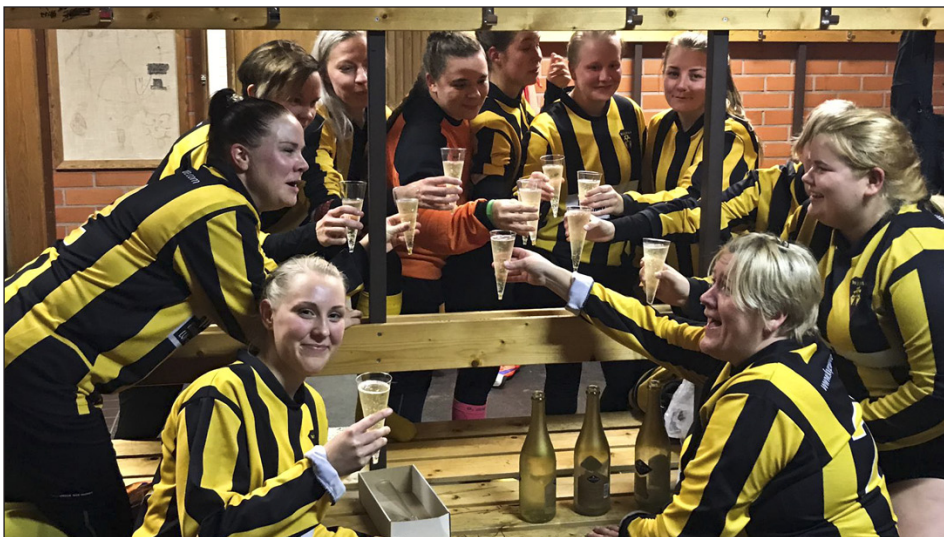
Wilppaan naiset juhlivat Länsi-Suomen piirin 8v8-sarjan mestaruutta kauden 2018 päätteeksi.

Tyttöjuniorien jalkapallotoiminta käynnistettiin Wilppaassa vuonna 1998, ja vuodesta 2005 lähtien se on ollut säännöllistä. Uusia kykyjä on siis kasvamassa.