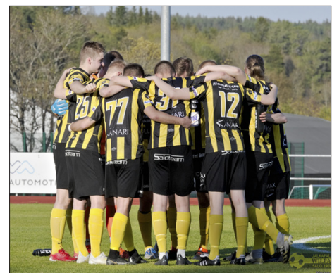
Keltamustat raitapaidat luovat joukkuehenkeä Wilpas-TPK-ottelussa 12.5.2023.

Kaudella 2023 Wilpas pelaa III divisioonaa. Pelipaidaksi on 2000-luvulta vakiintunut keltamusta raitapaita. Niinpä joukkuetta voi tälläkin kaudella innostaa 1950-luvulta peräisin olevalla kannustushuudolla: ”Wilppaan poika raitapaita, pallo rysän alle laita, hei, hei, hei!”