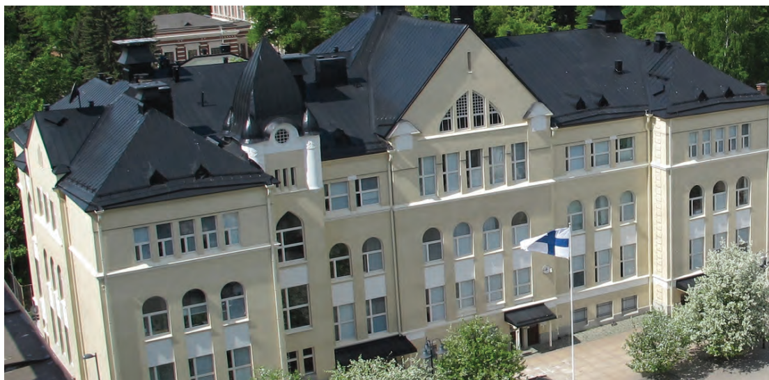
Arkkitehti Wivi Lönnin suunnittelema Aleksanterin koulu

Enkä nyt tarkoita raiteita, joita kaupungissa kulkijoiden sietokykyä koetellen rakennetaan ainakin seuraavat neljä vuotta. Meinaan nääs raitteja, joita voi kuljeskella hermojaan lepuuttaen. Kun sattuu sopivaa aikaa.