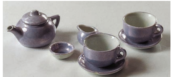
Nuken kahvikalusto. Valmistaja tuntematon.