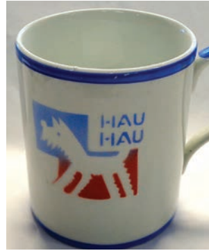
Hau-hau lastenmuki, Arabia. Valmistettiin vuosina 1949-1964.