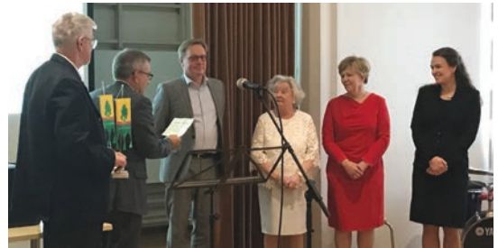
Keskusjärjestön ja Kaarilan omakotiyhdistyksen puheenjohtajat jakamassa viirejä ansioituneille yhdistyksen jäsenille.