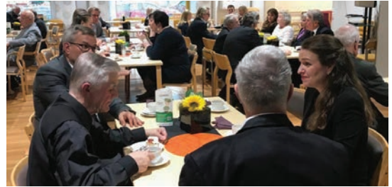
Juhlan väliajalla kakkukahvilla

Puheiden ja esitysten lomassa kutsuvieraille ja jäsenistölle tarjottiin hetki keskustelulle, kakulle ja pienelle suolaiselle.