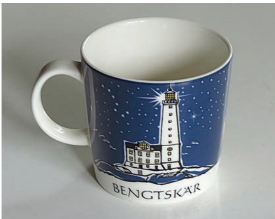
Bengtškär-muki, Arabia Käsittääkseeni tätä mukia on valmistettu pieni sarja, 2000 kappaletta.

Nämä kuppikuvat ovat nähtävillä Työväenmuseon Werstaan Komuutissa loppiaiseen saakka avoinna olevassa Kahvia!-näyttelyssä. Jos haluat katsella lisää kuppikoristeluja avaa tietokoneessa haulla Koristekirjasto, jossa on yli 900 Arabian koristemallia.