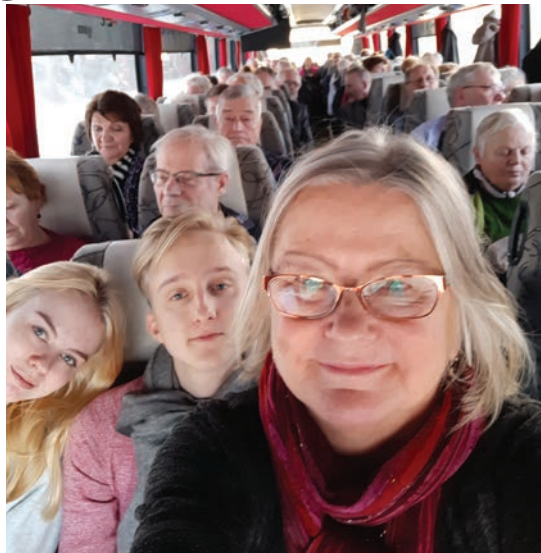
Terveisiä Riikan pikkujoulumatkalta

Toivotaan, että olisi sopivasti lunta. Ja siitä tulikin mieleen, että lähettäkääpä seuraavaan lehteen kuvia omista talven ihmemaistanne. Melkein kaikilla on kamera käsillä puhelimessa ja siihen taltioidaan toinen toistaan upeampia otoksia, luontokuvia ym. Omakotiviestin toimitus mieli jakaa niitä toisille omakotiasujille. Voi olla lapsia lumileikeissään tai aikuisia lunta luomassa, henkilökuviin pitää olla kuvattavan lupa.