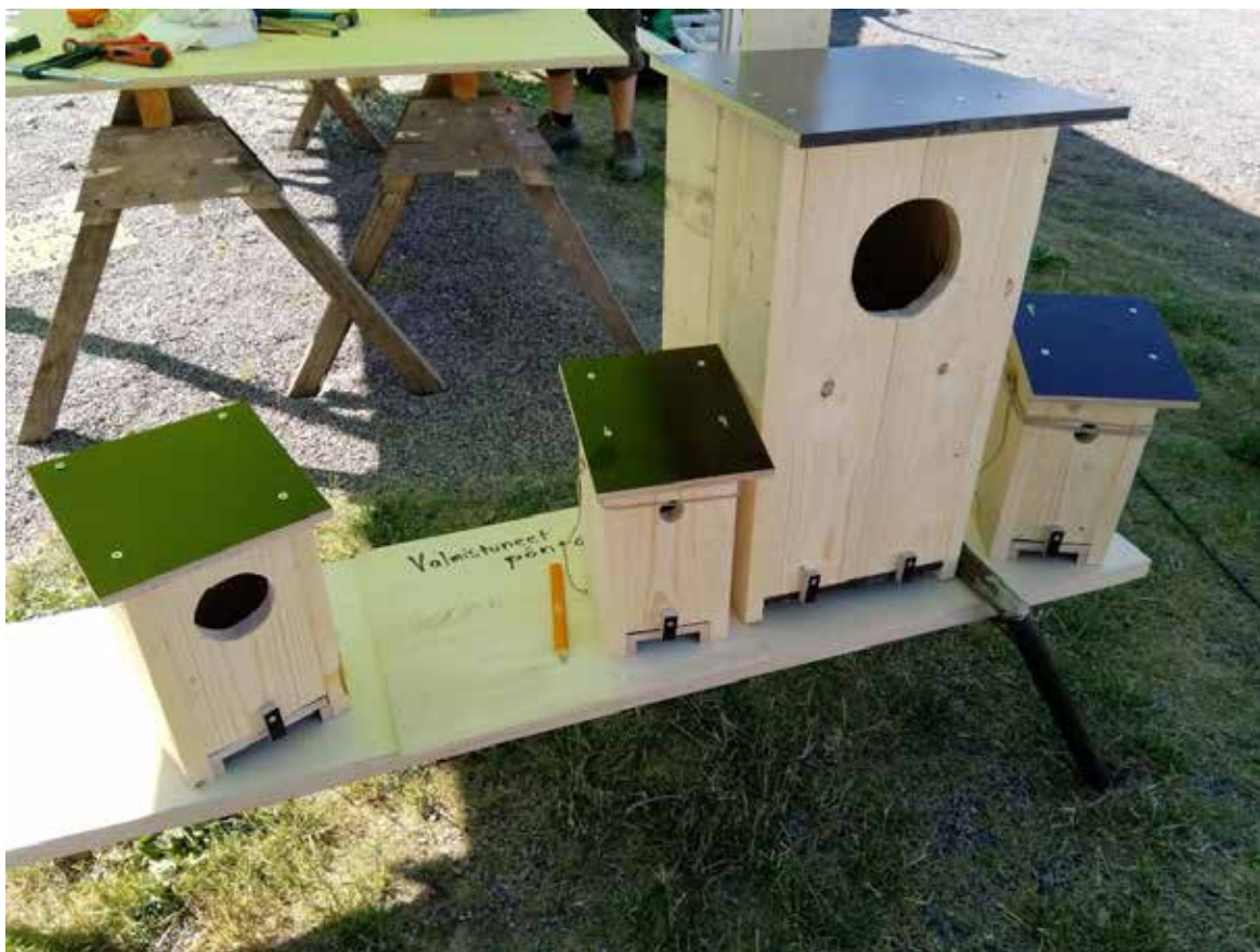
Pönttöjä moneen lähtöön..