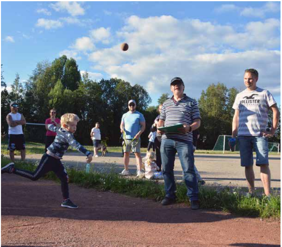
Pallo sai pojalta kyytiä.