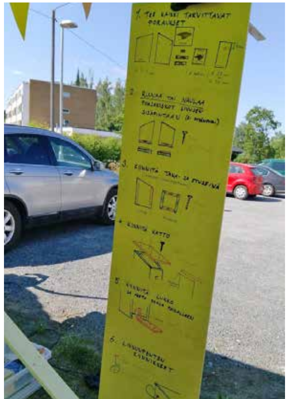
Ohjeet olivat selkeät ja osallistujat, lapsista alkaen, saivat onnistumisen iloa.