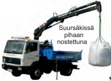
Suursäkissä pihaan nostettuna