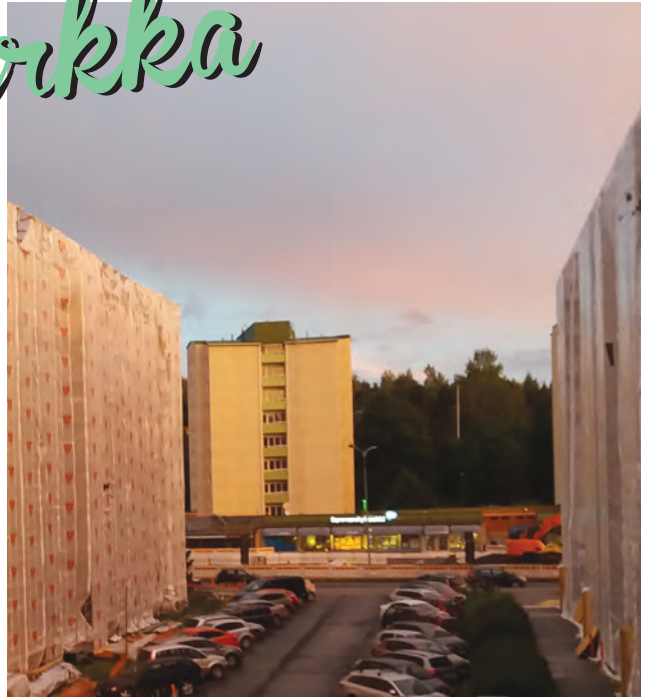
Raksat ja ratikka työmaat hiljenevät viikonlopuksi...

Perjantai oli kääntymässä iltapäivän puolelle. Työviikko rakennustyömaalla oli lo-puillaan. Rappari Rape, Tenu Topi ja Vänninen olivat ruokatunnilla pistäytyneet pitkäripaisessa hankintareissulla. Raskaat rakennustyöt nääs vaativat voimia palauttavaa voimajuomaa. Niinpä kolmikko olikin hankkinut muutaman putelin kyseistä ainetta.