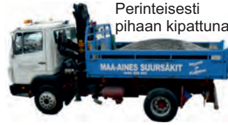
Perinteisesti pihaan kipattuna