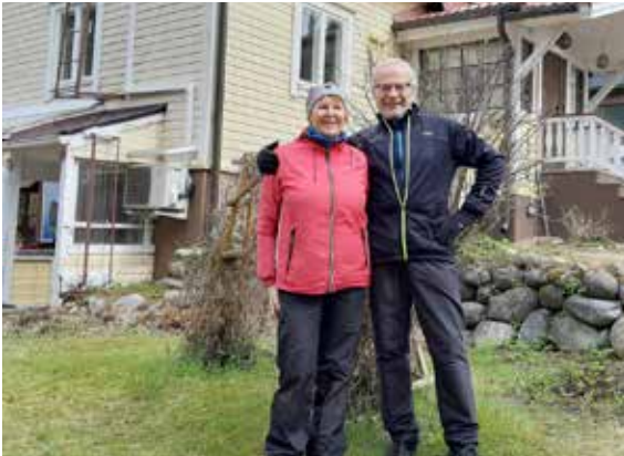
Hyvöset talonsa edustalla