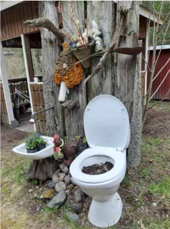
Ympäristötaidetta á la P.Sillman

detta syntyy melkein mistä vaan aineksista. Sillmanien portin tunnistaa kukkatelineenä toimivasta vessanpöntöstä.