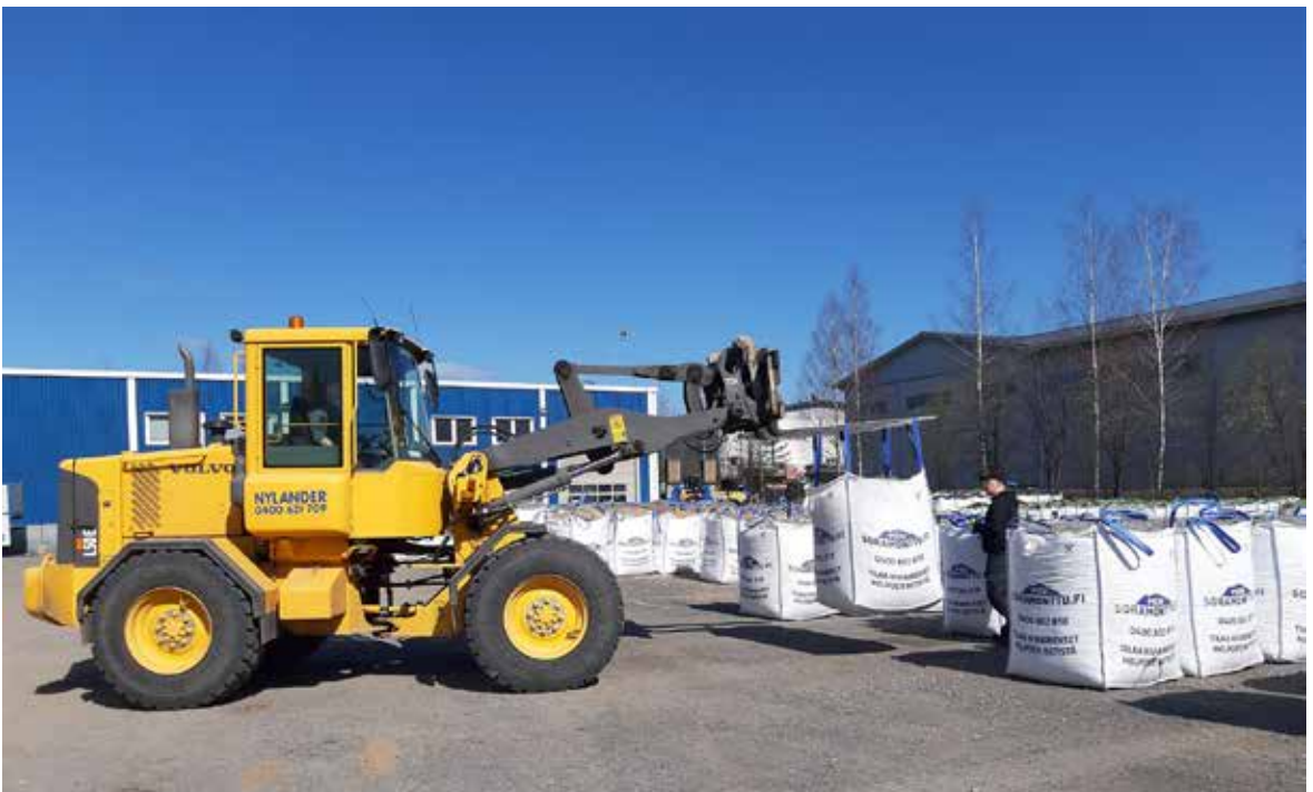
Tilaus on tullut ja säkit siirtyvät traktorilla autoihin