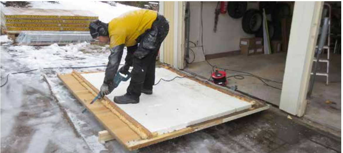
Vanhat ovet puukkosahalla kahtia