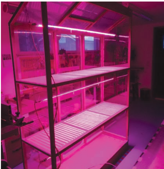
Kasvihuoneessa on LED-valot päällä

Vaikka ilmastonmuutos on pitkittänyt kasvukautta, se on meidän leveyspiirissämme edelleen lyhyt ja epävakainen. ”Siksi suosittelun rohkeasti rakentamaan pihalle oman kasvihuoneen”, Paulamäki ehdottaa. Hän ei tarkoita mitään isoa rakennusta, vaan alkaa voi pienestä. ”Pari kuukautta aiemmin keväällä voi hyötykasvit kylvää ja istuttaa kasvihuoneeseen valoa saamaan.” Eikä vain päivällä, vaan Jari Paulamäki suosittelee myös led-valojen asentamista kasvihuoneeseen. Näin hyödynnetään myös pimeä aika.