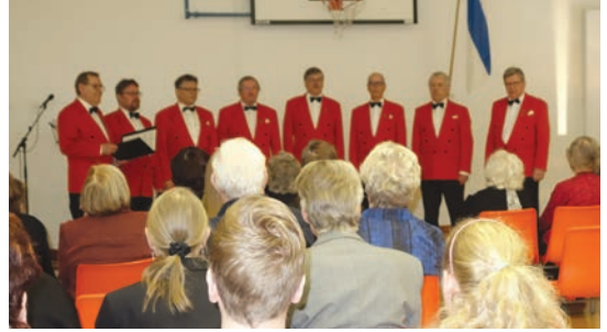
Nokian työväen mieskuoron ryhmä kajautti illoille juhlat sävelet