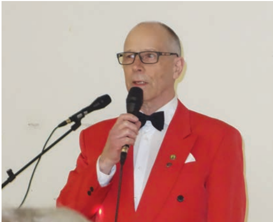
Yhdistyksen aktiivi, keskusjärjestön varapuheenjohtaja toimi tilaisuuden juontajana