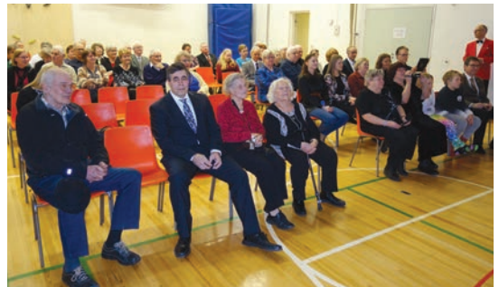
Kalkun omakotiväki nautti sekä juhlan kulttuuripitoisista että kahvipöydän herkullisista antimista