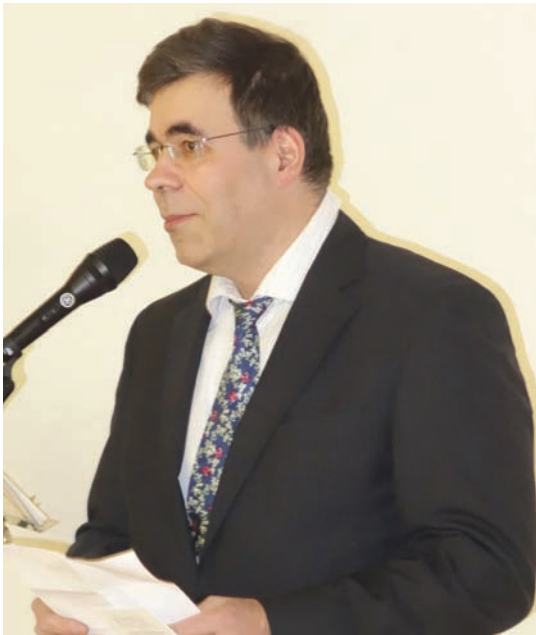
Yhdistyksen uusi puheenjohtaja piti puheen