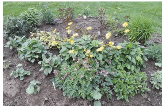
Takapihan varjoisampi paikka sai hienon perennapenkin