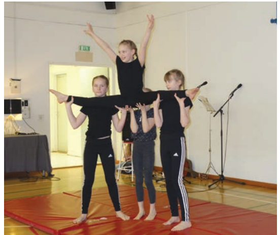
Koulutyöt olivat notkeita vanhemman yleisön ihmetel- lessä