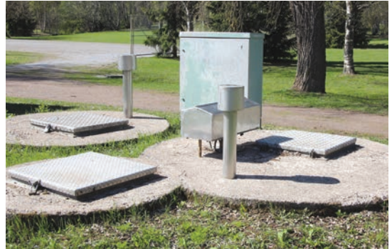
Notkopaikoissa voidaan tarvita jäte- ja hulevesipumppaamoita.

Omalta tontiltamme hulevesiä ei juurikaan mene katujoaan. Kattovedet ja salaojavedet imeytetään, mikä savimaasta huolimatta toimii hyvin - ainakin tällä rinnetontilla. Pihan kivetetyn alueen raot imevät yllättävän kovienkin sateiden vedet. Katuojaan asti vettä menee vain kaikkein rankimmilla sateilla. Vedet imeytyvät niin nopeasti, ettei ojassa ole näkynyt virtauksia, vaikka valuneesta vedestä suurin osa tulee kadun kestopäällystetyltä alueelta. Tontilla imeytyneestä hulevedestä haihtuu osa mm. puitten kautta, mutta pääosa virtaa todennäköisesti muutaman metrin syvyydes-