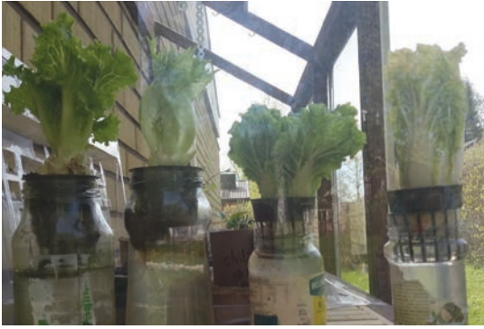
Oletko ostanut kaupasta kiinankaalin? Oliko se haalean vaalea? Näin saadaan kiinankaali vihreäksi