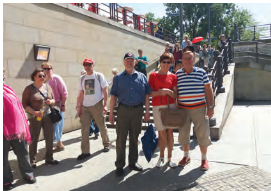
Aurinko hellii meitä koko matkan matkan ajan. Tässä kiirehditään DDR-museoon.

Maanalaisella matkustaminen on nopeaa, mutta ensitutustuminen uuden kaupungin kulkupeliin on aina oppi- misen paikka. Opas oli antanut neuvot maksuista, mutta automaattien kans- sa oli silti omat konstinsa. Kahdella