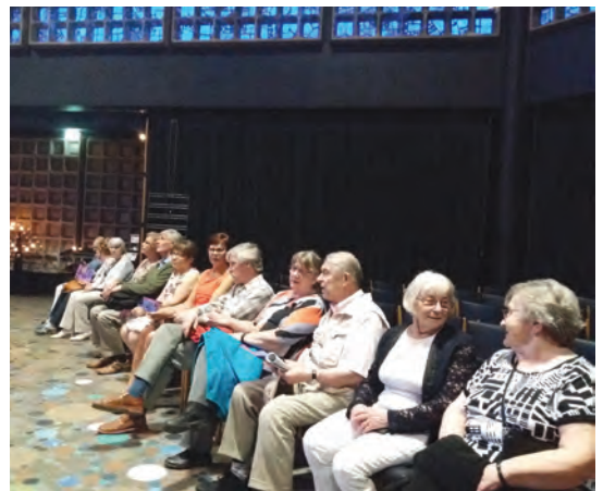
Konsertti sai monen silmän kostumaan.