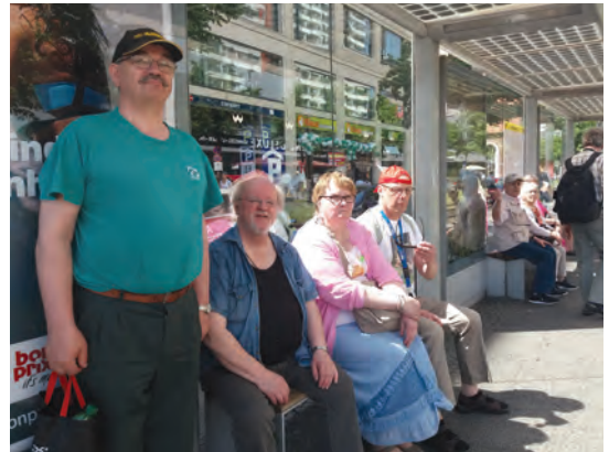
Tampereelaisten pitää varrotta ratikkaa. Berliinissä kolme minuuttia, Tampereella kolme vuotta.

maksupaikalla saimme kuitenkin niin kolikko- kuin korttimaksut hoidetuiksi. Kokeneemmat ohjasivat vähemmän maksulaitteisiin tottuneita. ”Onneksi ollaani euromaassa”, joku tiimellyksessä tokaisi. Saman valuutan käyttö ja muu- toinkin hintojen vertailu on helppoa. Seitsemän euron päivälippu, jolla sai ajella keskusta-alueella ratikalla, maan- alaisilla ja -päällisillä junilla sekä bus- seilla mielin määrin, oli aika edullinen.