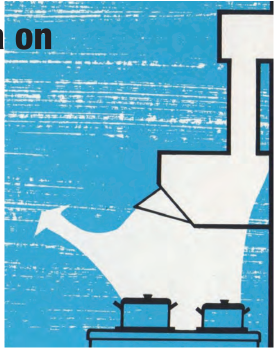
Liesikuvun tai tuulettimen käyttö alkoi vakiintua 70-luvulla

Kuusikymmentäluvulla varallisuus nousi edelleen. Tehtiin tiiliverhottuja ta-