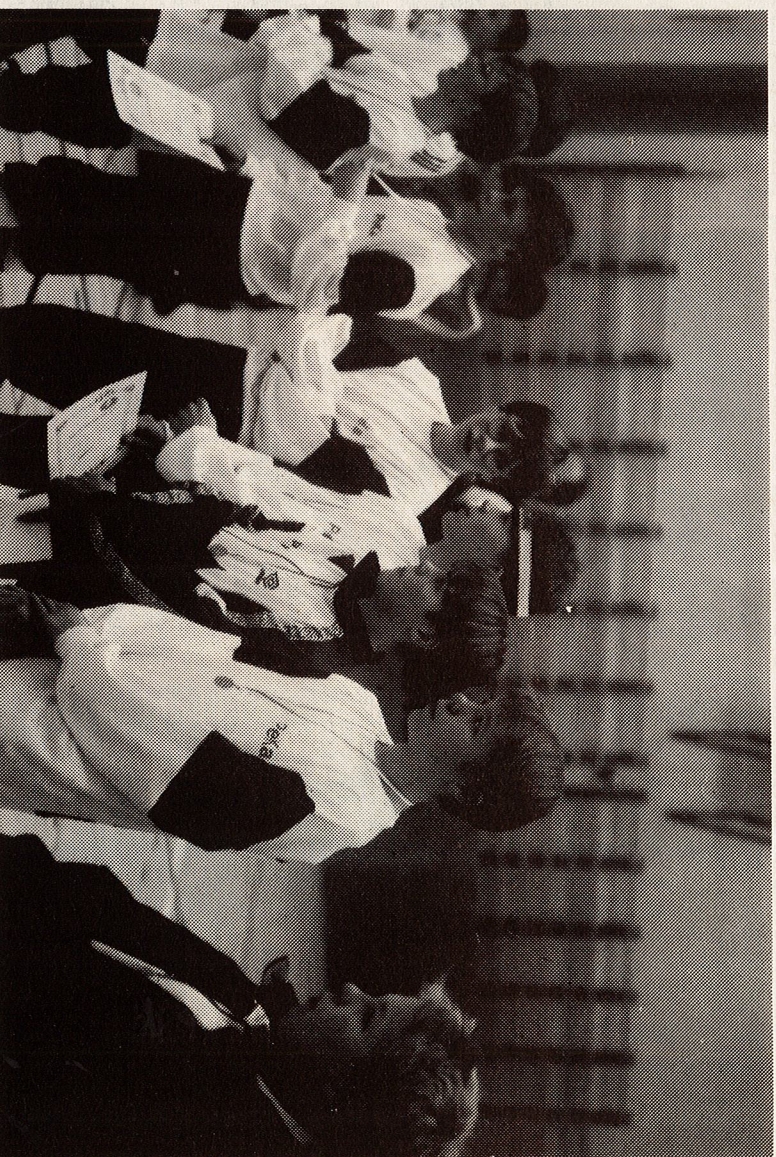
Mitalit kaulassa on mukava lähteä kotimatalle.

VOITAT VARMASTI KUN KESTITÄT VAKUUTUKSESI