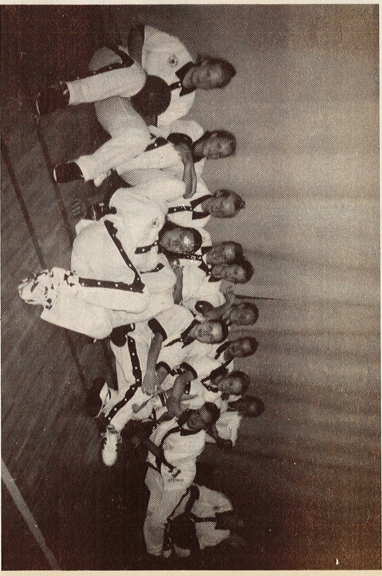
A-tytöt Tytöt tauolla Espoossa.

Työtämme sijoituivat toiseksi häviön erittäin tasaisen ottelun Lappeenrannan NMKY:tä vastaan.