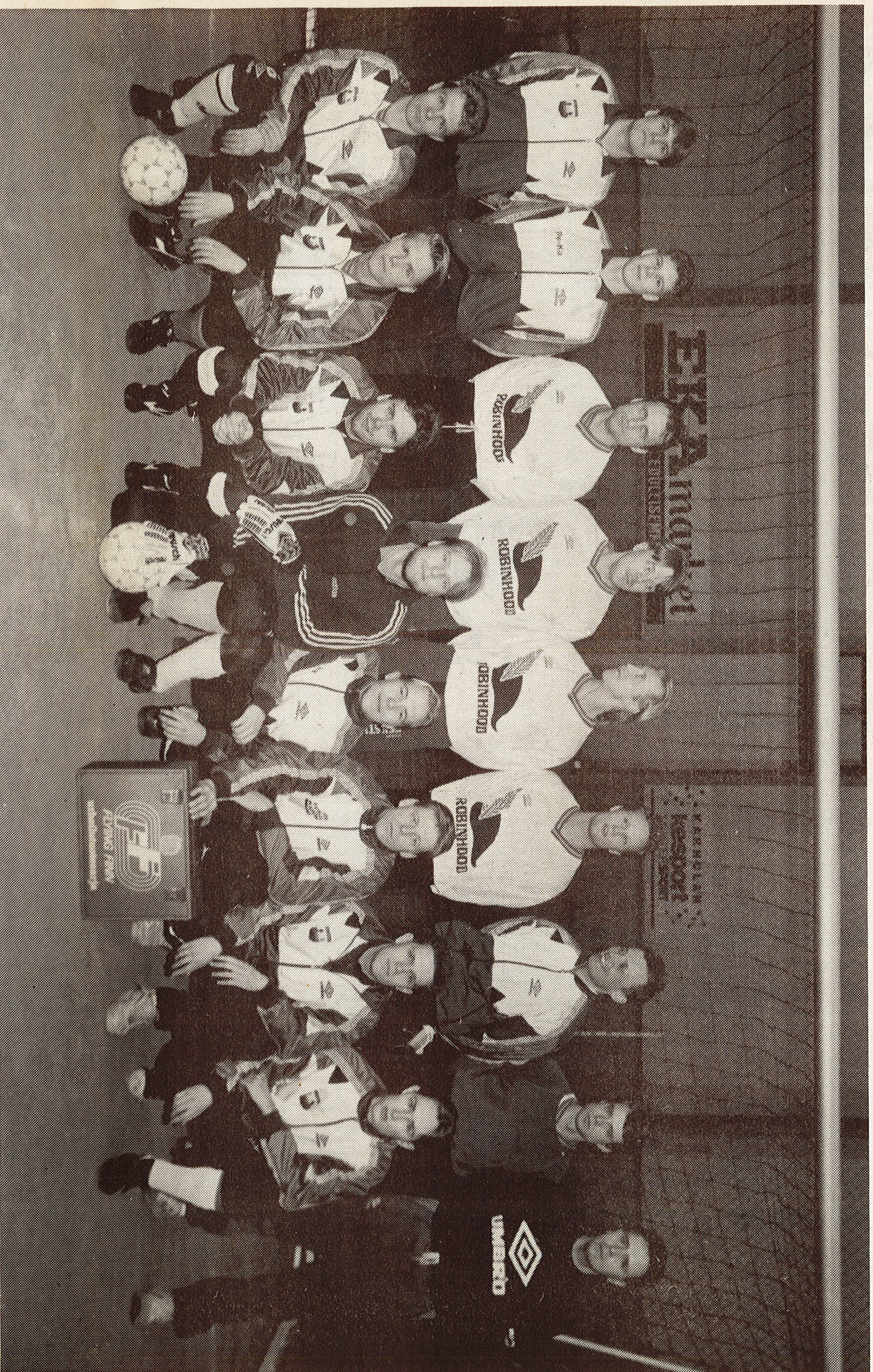
Peli-Karhujen edustusjoukkue on sekoitus vanhaa kokemusta ja nuoria intoa. Harjoitusryhmään kuuluu yli 20 pelaajaa. Loukkaantumiset ja armeija haittavat muutamien osallistumista yhteistreeneihin.