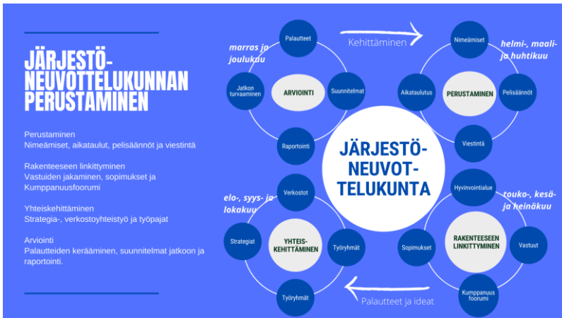
Kuvio 4: Järjestöneuvottelukunnan perustaminen