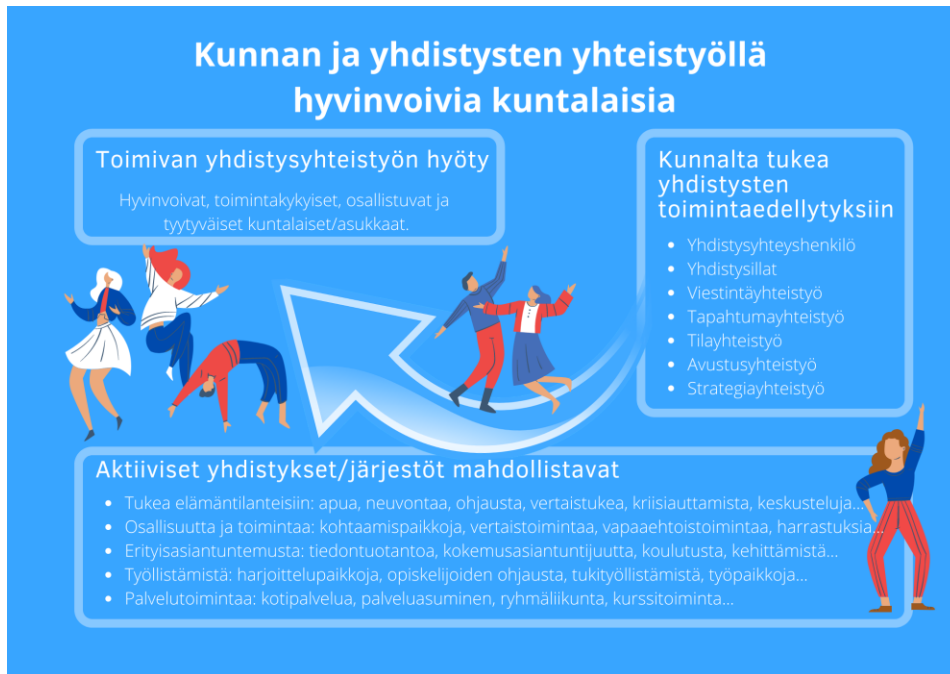
Kuvio 2: Kunnan ja yhdistysten yhteistyöllä hyvinvoivia kuntalaisia

Kuntien tiivis yhteistyö yhdistysten ja järjestöjen toimintaedellytysten tukemisessa hyödyttää kuntalaisia ja mahdollistaa asukkaille hyvinvointiin, terveyteen ja turvallisuuteen kattavaa tukea. Kunnan mahdollistama monipuolinen tuki yhdistysten ja järjestöjen toimintaedellytysten tukemiseksi moninkertaistuu osallisuuden, yhteisöllisyyden ja omaehtoisen toiminnan kautta toiminnassa mukana oleville.