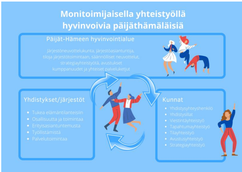
Kuvio 3: Monitoimijaisella yhteistyöllä hyvinvoivia päijäthämäläisiä

Suunnitelmallinen ja tavoitteellinen monitoimijainen yhteistyö mahdollistaa asukkaille osallisuutta, yhteisöllisyyttä ja hyvinvointia. Eri toimijatahojen saumaton yhteistyö mahdollistaa kattavasti hyvinvoinnin, terveyden ja turvallisuuden edistämistä. Kunnilla, yhdistyksillä ja hyvinvointialueella sekä muilla toimijoilla on kaikilla oma tärkeä rooli hyvinvoivien päijäthämäläisten turvaamisessa.