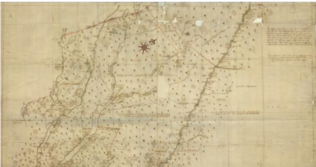
Fryksdalenin ja jokilaakson kartta vuodelta 1658.