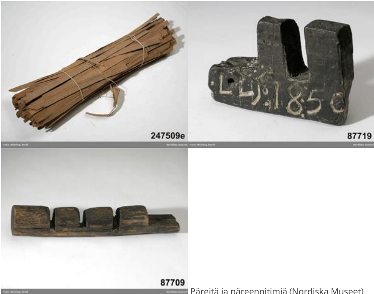
Päreitä ja päreenpitimiä

Pirtit siivottiin pari kertaa vuodessa. Silloin harjattiin katosta noki pois, niin että siitä tuli kiiltävän musta. Seinien alaosat kuurattiin puhtaaksi ja viimeiseksi pestiin lattia.