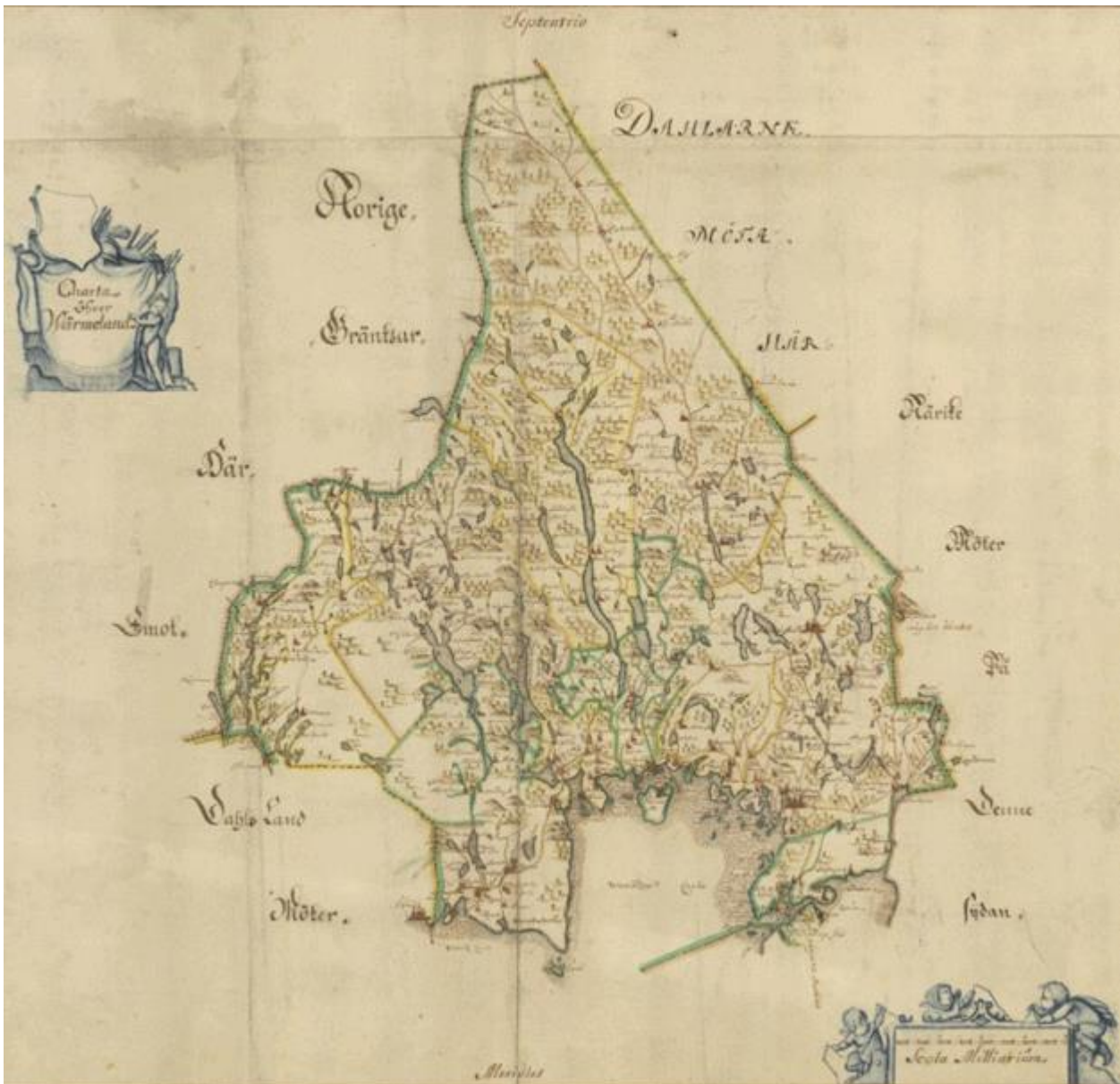
Käsin piirretty maakuntakartta Värmlannista 1600-luvun lopulta.