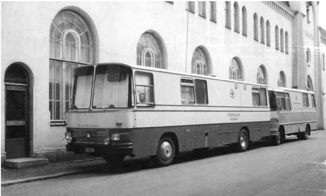
Työterveyslaitoksen tutkimusautot Finlaysonilla vuonna 1972.

Tästä sopiikin olla ylpeä. Kiitämme yhdistyksen puolesta teitä perustajajäseniä!