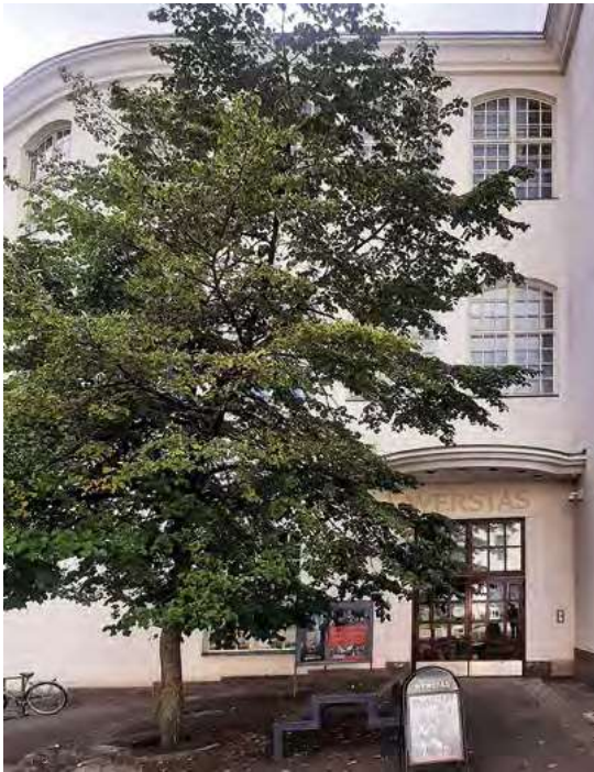
Työväenmuseo Werstas on ollut TSTLY:n iltapäiväseminaarien vakiopaikka – yhdistyksen syntyjuurien äärellä.

Stressiaiheinen seminaari oli tarpeen vuoden 1980 työelämässä. Vuonna 1982 jatkettiin työväestön psyykkisistä häiriöistä. Vuonna 1984 digitaalisuus oli jo huomioita-