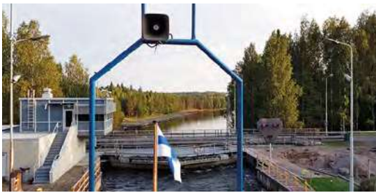
Ylempi kuva: Sää suosi laivamatkailua. Alempi kuva: Saimaan kanavalla.

Hallitus oli jo kesällä huomannut lehtiotsikoista, että joillakuilla oli ollut viallinen Suomen passi, mikä oltiin huomattu vasta Venäjän rajalla. Pysähdyimme miettimään, pitäisikö juhlaväelle vinkata etukäteen, että passien vesileimojen suunta olisi tarkistettava. Pohdinnan jälkeen totesimme, että ehkäpä muistutus hyvistä kengistä kävelykierrokselle riittää, ja jokainen vastaa passistaan. Sihteerimme ahkerasti muotoili vinkkejä.