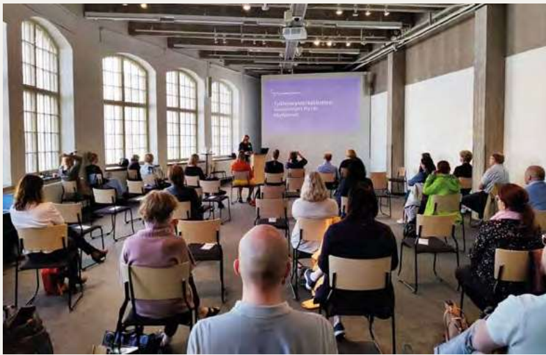
Iltapäiväseminaari Werstaalla. Laatu terveystarkastuksiin -seminaari 10.9.2021 oli menestyksenkäs korona-ajasta huolimatta.