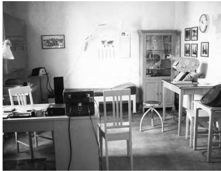
Tutkimushuone Finlaysonin työterveysasemalla Kortelahdenkadulla vuonna 1978.