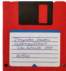
Jäsentiedot saatiin vuonna 1997 jo korpulle, mutta tiedot kerättiin jäseniltä vielä kirjekselyin.