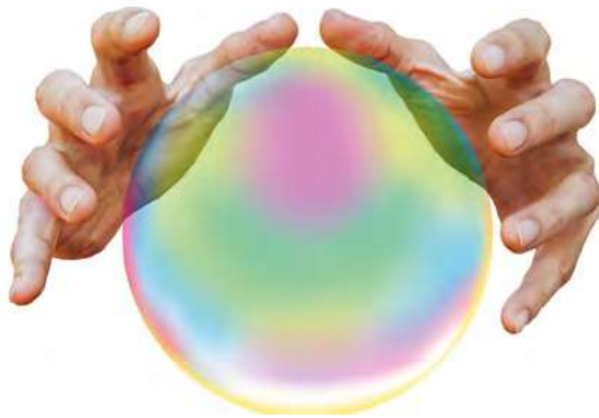
Kristallipallosta työterveyshuollon tulevaisuus