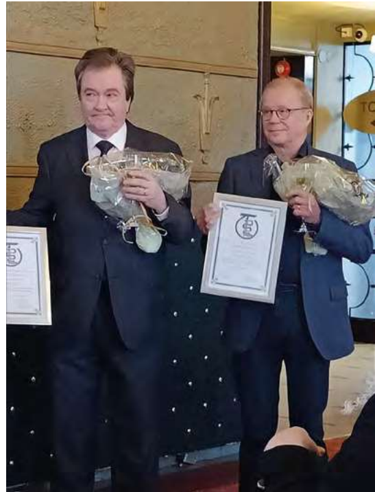
Kunniajäsenten kukitus 20.1.2023

80-vuotiaat perustajajäsenet ovat olleet merkittävässä rooleissa työterveyden valtakunnallisessa kehittämisessä. Jotkut ovat jo poistuneet keskuudestamme ja haluammekin kunnioittaa myös heitä.