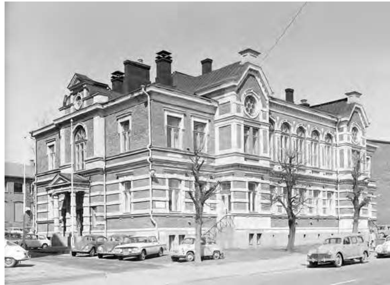
Tampellan työterveysasema sijaitsi Tampellan juhlatalossa, jossa nykyään toimii Tampereen Komediateatteri. Myöhemmin työterveysasema toimi Tampellan Tehdasrakennuksessa, jossa sittemmin oli myös Pihlajalinnan Kelloportti-yksikkö.

Jo alkuaajoista lähtien järjestettiin lisäksi erilaisia seminaareja. Vuonna 1975 yhdistys järjesti ensimmäisen kerran Tampereella STLY:n valtakunnalliset työterveyspäivät. Lisäksi tutustuttiin erilaisiin tehdasympäristöihin.