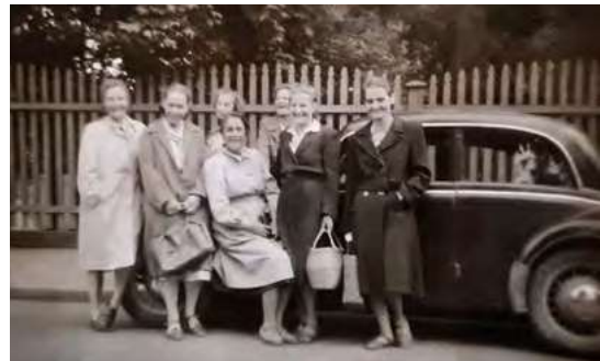
Tuovi noin seitsemänkymppisenä 1980-luvulla.