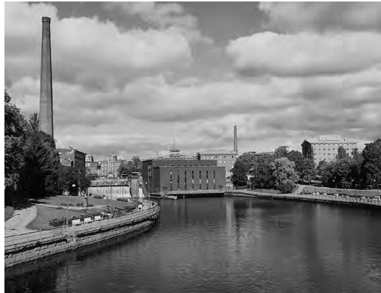
Tammerkosken rannan vaikuttava tehdasmiljöö on Suomen ensimmäinen teollinen kaupunkimaisema ja yksi kansallismaisemistamme. Kuva Maria Mäkinen.

Tekstiilituotanto loppui 1970–1980 luvulla tekstiiliteollisuuden toiminnalliseen murrokseen. Suomalaisen tekstiiliteollisuuden