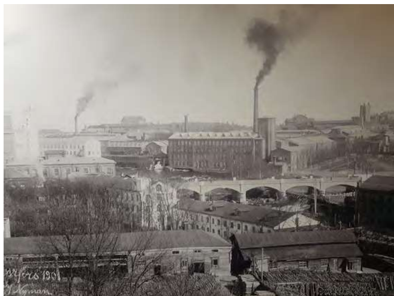
Tampere vuonna 1901.