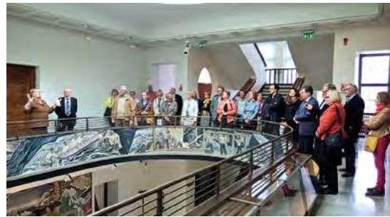
Mänttä-Vilppulan kevätretki 8.5.2015, elämyksellistä paperiteollisuuden ja Serlachiuksen historiaan sekä taidemuseo Göstaan tutustumista. Bussi lähti Tampereen Vanhalta Kirkolta tavan mukaan ja retkellä oli tunnelmaa, hyvät ystävät ja hyvää ruokaa.

Tutustumismatkoja on tehty muun muassa Grafiikanpaja Himmelblauhun ja Plevnan panimoon. Kevätretkillä on käyty ainakin Hoikan kuntoutuskeskuksessa, Sastamalan ja Tyrvään vanhoilla kirkkoilla sekä Ellivuoren Pirunvuorella.