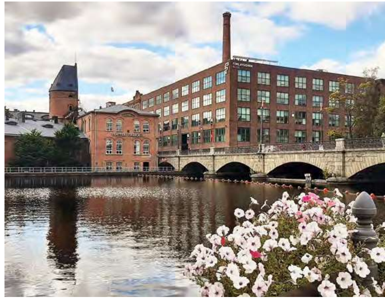
Säilyneet punatiilisavupiiput ovat vanhan teollisen Tampereen tunnusmerkkejä.