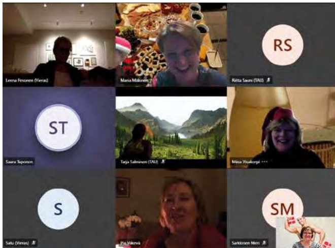
Teamsin ruutujen äärellä etäpikkujouluissa joulukuussa 2020.

Marraskuussa 2022 vietettiin pitkän koronakurimuksen jälkeen perinteisemmät pikkujoulut. Juhlatalo Hovissa Sukkavartaankadulla oli paikalla nelisenkymmentä osallistujaa, jäseniä puolisoineen. Saimme nauttia improvisaatioteatteri Snorklaamon esityksestä ja loppuillasta tanssiyhtye veti yleisön tanssilattialle. Osa seurusteli pöydissä rennosta tunnelmasta nauttien.