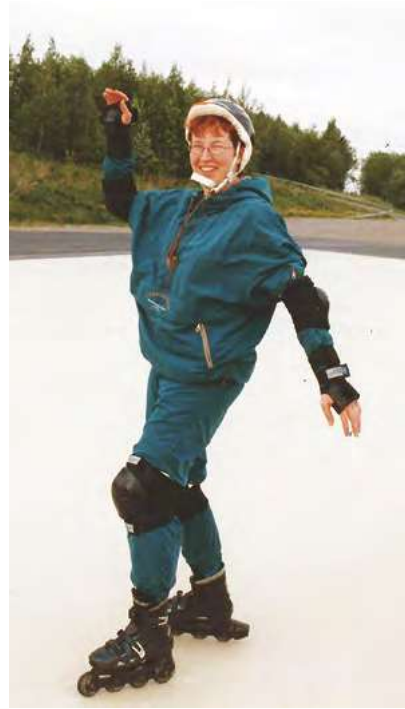
Selinan lennokkaat erikoistumisvuodet.

1990-luku ei ollut pelkkää lamaa, vaan myös uusien tuulien aikaa. Matkapuhelimet valloittivat Suomea ja maailmaa, Nokia lähti nousuun. Tekstiviestit keksittiin. Internetin ihmeellinen maailma alkoi avautua. Tampere oli kehityksen ytimessä ja veti puoleensa monia Seinäjoen seudun nuoria aktiivisia naislääkäreitä.