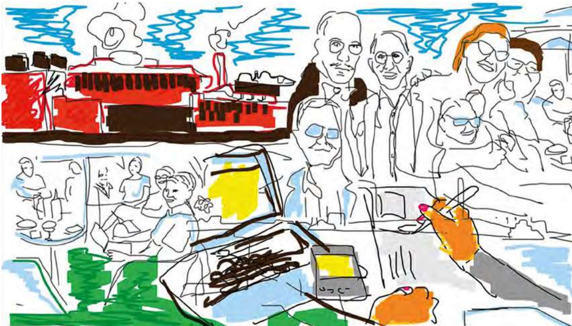
“Työterveyslääkärien arvon mukaista henkeä ja ystävyyttä.” Piirros Päivi Petrelius.

Vuodesta 2001 lähtien kaikki puheenjohtajat ovat olleet naisia. Myös hallitus naisistui 2000-luvulla niin, että vuosina 2015 ja 2018–2020 kaikki hallitusjäsenet olivat naisia. On hienoa, että vuodesta 2021 alkaen miesedustus on jälleen viriämässä.