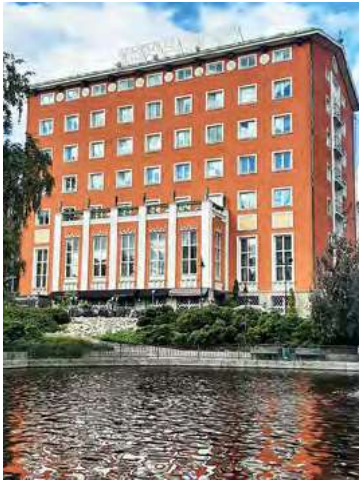
Ensimmäinen Coffee Break pidettiin 3.9.1993 hotellilla Tammerissa.