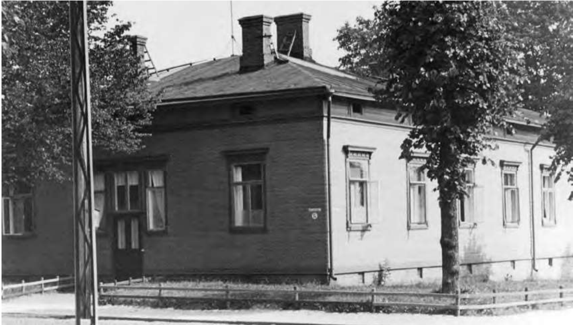
Finlaysonin sairaala vuodelta 1893. Tampereella Finlayson & Co Oy:n aluksi viisi- ja myöhemmin kaksitoista-paikkainen sairaala aloitti vuonna 1867 suurten nälkävuosien aikaan, jolloin kymmeniä puuvillatehtaalaisiakin sairastui lavantautiin. Uusi 21-paikkainen sairaala valmistui tehtaalle vuonna 1893 ja toimi vuoteen 1964.

massa ja korjaamassa usein esiintyviä pieniäkin epäkohtia, joista ehkä voi kootua suuriakin seurauksia; samoin mikäli mahdollista olisi heidän tutustuttava työväestön asunto- ja elinoloihin, voidakseen saada tarvittavia parannuksia toimeen.