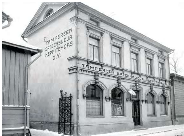
Tampereen Sateensuoja- ja Keppitehdas Oy, 1909.