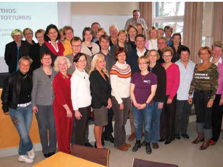
Seitsemän tamperelaista kollegaa STLY:n etiikkakurssilla Helsingissä vuonna 2008.

Mieleepainuvia ovat olleet 2010-luvun yhteistyötapaukset muiden erikoisalojen kanssa. Ensin käytiin keskustelut Tampereen työterveyslääkäreiden ja psykiatrien välillä liki 100 ammattihenkilön voimin. Keskustelu oli erinomaista ja käytännönläheistä, ja siitä saatiin hyvää palautetta molemmiin puolin. Vastaavanlainen tilaisuus järjestettiin myöhemmin Hatanpään ortopedien kanssa. Reumatologeja ei liioin unohdettu.