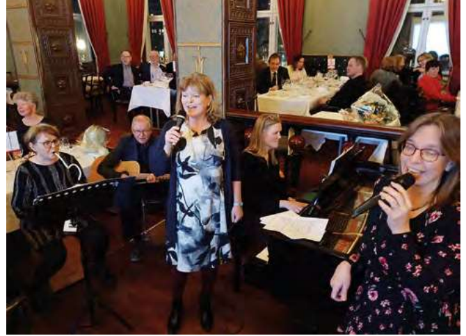
Coffee Break 30 vuotta -juhlan bändi sai koko väen laulamaan letkeällä tyyliällään 20.1.2023.