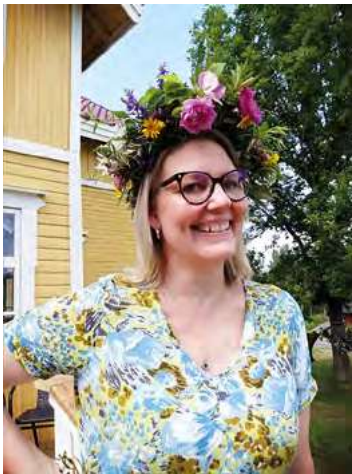
Minnan motto: "Meidät on tehty toisia varten, toistemme surujen siruja varten" (Vesterinen yhtyeineen).

Moniammatillisuutta ei voi työterveyshuollossakaan liikaa korostaa. Työterveyshuollossa suunnittelemme ja toteutamme yhdessä työterveyshoitajien kanssa työntekijälle oikeanlaisen hoito- ja kuntoutussuunnitelman. Työfysioterapeutti ja toimintaterapeutti arvioivat työ- ja toimintakykyä, työterveyspsykologi arvioi kognitiivista työkykyä, ammatillisen kuntoutuksen mahdollisuuksia ja mielialaa. Työterveyshoitaja tukee ja kannattelee, pitää langat käsissään, jotta prosessi voi edetä.