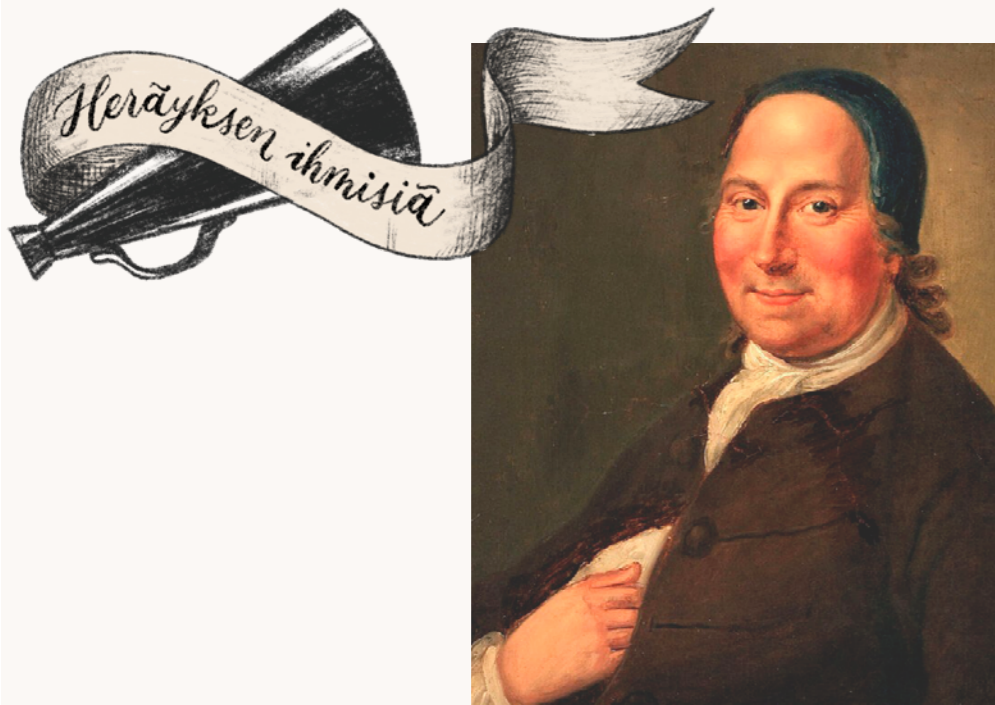
Nikolaus von Zinzendorf s. 1700 – k. 1760