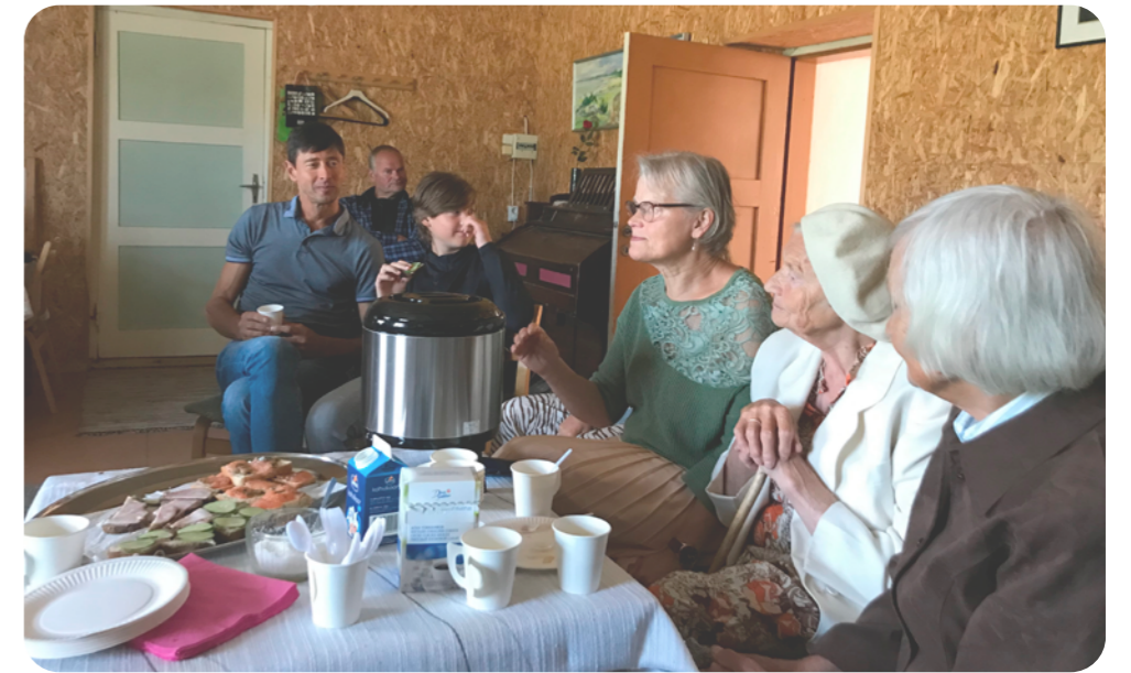
Kahvitilaisuus Mustjalan kirkon sakastissa

180 000 jäsentä. Se on 13 % Viron väestöstä.