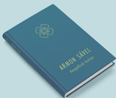
Kuva on suuntaa-antava.

”Runsaasti asukoon teissä Kristuksen sana; opettakaa ja neuvokaa toinen toistanne kaikessa viisaudessa, psalmeilla, kiitosvirsillä ja hengellisillä lauluilla, veisaten kiitollisesti Jumalalle sydämässänne.” Kol.3:16 ■