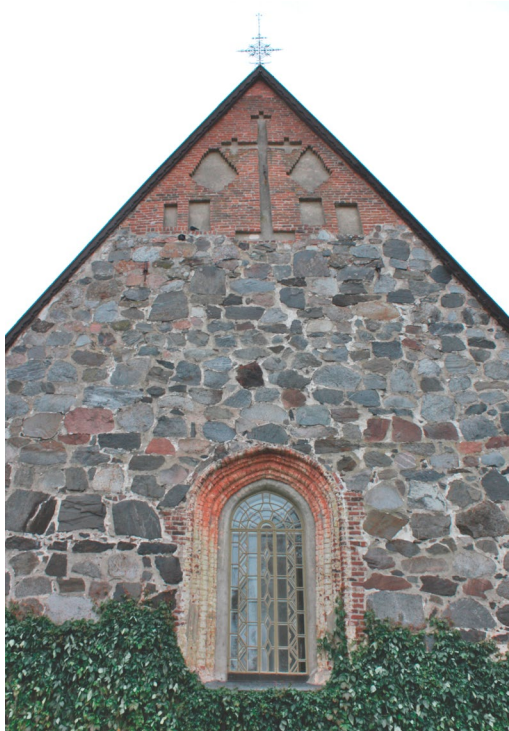
Lammin kirkko

viimeisen tuomion tapahtumista. Siinä hetkessä ihminen on Tuomarinsa edessä vailla mahdollisuutta itse vaikuttaa kohtaloonsa ja tulevaisuuteensa. Silloin on kysymys asiasta, joka ei enää koskaan tule muuttumaan. Tämä evankeliumi ei ole vertaus, vaan se on Jeesuksen puhuma profetia asioista, jotka tapahtuvat silloin kun ihmisen aika täällä maan päällä on ohitse ja koko luomakunnan aika on kulunut loppuun. Silloin tulee hetki, jolloin Ihmisen Poika tulee kirkkaudessaan ja istuu kirkkautensa valtaistuimelle. Luettu teksti ei jätä epäselväksi sitä, kenellä siinä hetkessä on käsissään kaikki valta ja kenellä on oikeus tuomita, eikä jää epäselvyyttä siitä, kuka on tuomittavan osassa ja mikä on tuomio. Jeesus Kristus istuu toisessa tulemisessaan valtaistuimellaan, Hänen kirkkautensa ja kunniansa istuimella. Kaikki kansat ja kaikki ihmiset, jotka ovat tänne kerran syn-