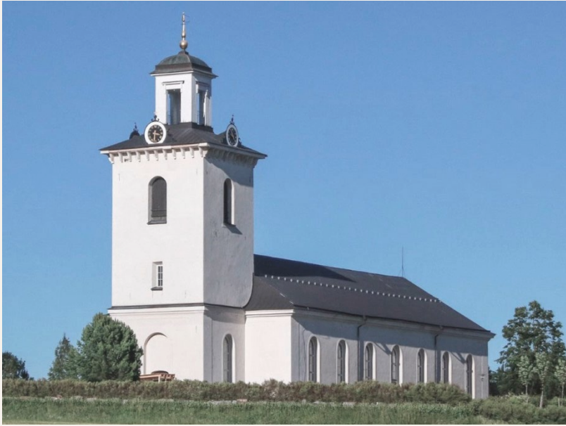
Noran kirkko, jossa Brandell saarnasi

vapaasta armosta ja lahjavanhurskaudesta. Piteän nuorisoherätys muuttui evankeliseksi lukijaisuudeksi.