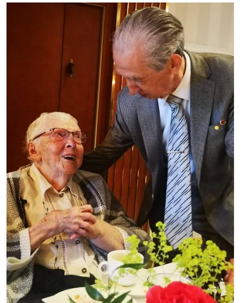
Yhdistyksen 40v. juhlat Naantalın kylpylässä 11.6.2022