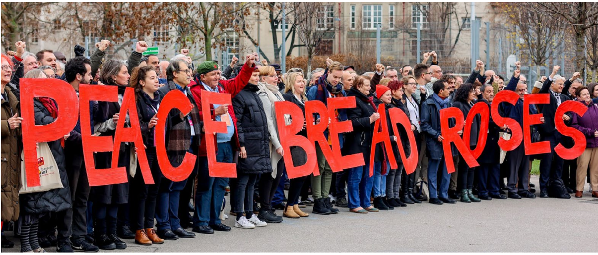
Euroopan vasemmiston joulukuun 2022 kongressin osallistujien yhteiskuva "Rauhaa, leipää, ruusuja" -viestin kanssa Itävallan Wienissä.

on vuonna 2004 perustettu Euroopan vasemmisto, joka edelleen jatkaa paremman Euroopan vaatimista. Euroopan vasemmisto nojaa sosialismin, kommunismin ja työväenliikkeen arvoihin ja perinteisiin, jossa ajetaan feminismiä, sukupuolten välistä tasa-arvoa, ympäristöliikkeitä ja kestävä kehitystä, rauhaa, kansainvälistä solidaarisuutta, ihmisoikeuksia, humanismia, antifasismia, edistysellistä ja avointa ajattelua.