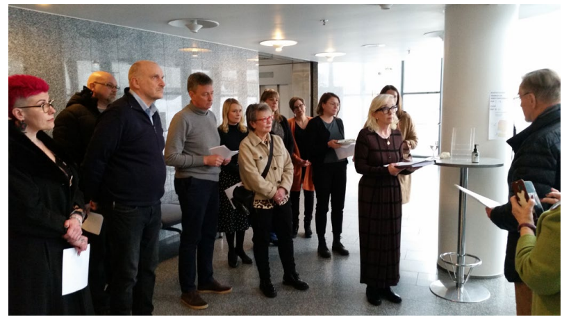
Hyvinkääläiset ja tuusulalaiset vetosivat tammikuussa Keusoten aluevaltuustoon Sandelininkadun sekä Jokelan ja Kellokosken terveysasemien jatkamisen puolesta.

Keusoten palveluverkkosuunnitelmassa esitetään monessa kohdassa olemassa olevien rakennusten korvaamista uudisrakennuksilla, esimerkkinä Kiljavan kuntoutuskeskus ja Mäntsälän Kotokartano.