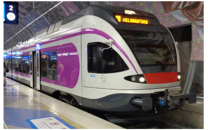
Sm5-junayksikkö nro 44 Lentoaseman rautatieasemalla.

kuitenkin isoa muutosta suhtautumisessa liikennepolitiikkaan ja esimerkiksi kaavoitukseen. On tehtävä rohkeita ratkaisuja, joilla joukkoliikennettä edistetään ensisijaisesti yksityisautolun sijasta.