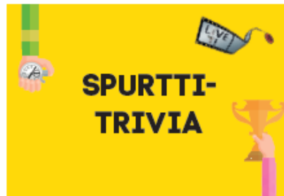
Spurttitrivia: 139€ sis. alv 24%