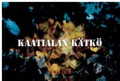
Kaatialan kätkö: 119€ sis. alv 24%