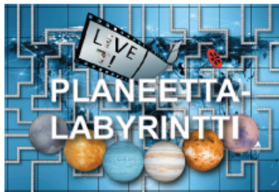
Planeetalabyrintti: 139€ sis. alv 24%

Live It! -liikkuvat lautapelit saatavana nyt koulujen omaan käyttöön!