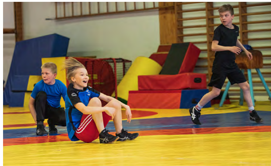
Poikien painitreenit.

Päijät-Hämeessä on tehty jo vuosia suunnitelmallista työtä liikunnan edistämiseksi. Päijät-Hämeen ensimmäinen terveysliikuntastrategia laadittiin vuosille 2009–2020. Sport Päijät-Häme strategia laadittiin vuosiksi 2016–2020. Lisäksi Päijät-Hämeessä on laadittu Liikunnan, elämysten ja hyvinvoinnin tiekartta 2030, johon on koottu kokonaisuuteen liittyviä kehittämistoimia. Tämä liikkumishjelma on jatkoa aikaisemmille strategioille. Ohjelma on myös osa Päijät-Hämeen hyvinvointisuunnitelman 2022–2025 toimeenpanoa ja ohjelmalla haetaan vaikutuksia Päijät-Hämeen hyvinvoinnin ja terveyden edistämisen painopistealueisiin eli hyte-kärkiin. Kuluva kauden hyte-kärkiä ovat mielen hyvinvointi, osallisuus ja yhteisöllisyys, arjen turvallisuus sekä päihteettömyys ja terveelliset elintavat.