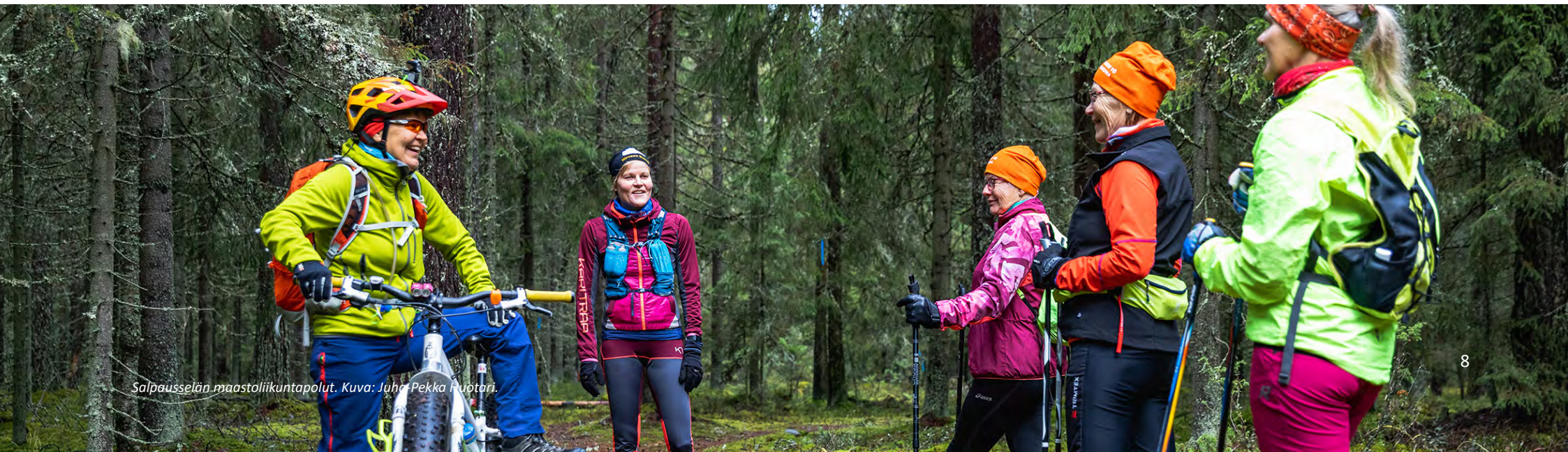
Salpausselän maastoliikuntapolut.

Hyvinvoinnin ja terveyden edistäminen ja sen osana liikunnallisen elämäntavan tukeminen on kunnille sekä hyvinvointialueille strateginen valinta, joka ohjaa resurssointia ja rahoitusta. Julkisen rahoituksen lisäksi on haettavissa erilaisia hankerahoituksia muun muassa: Opetus- ja kulttuuriministeriöstä liikunnalliseen toimintaan, liikunta-paikkarakentamiseen ja luonnon virkistyskäyttöön; Traficomilta kävelyn ja pyöräilyn edistämiseen; ELY:ltä lähivirkistysalueiden kunnostukseen. Kohdennettujen avustusten ja hankkeiden avulla on mahdollista täydentää perusrahoituksella toteutettavaa työtä ja investointeja.