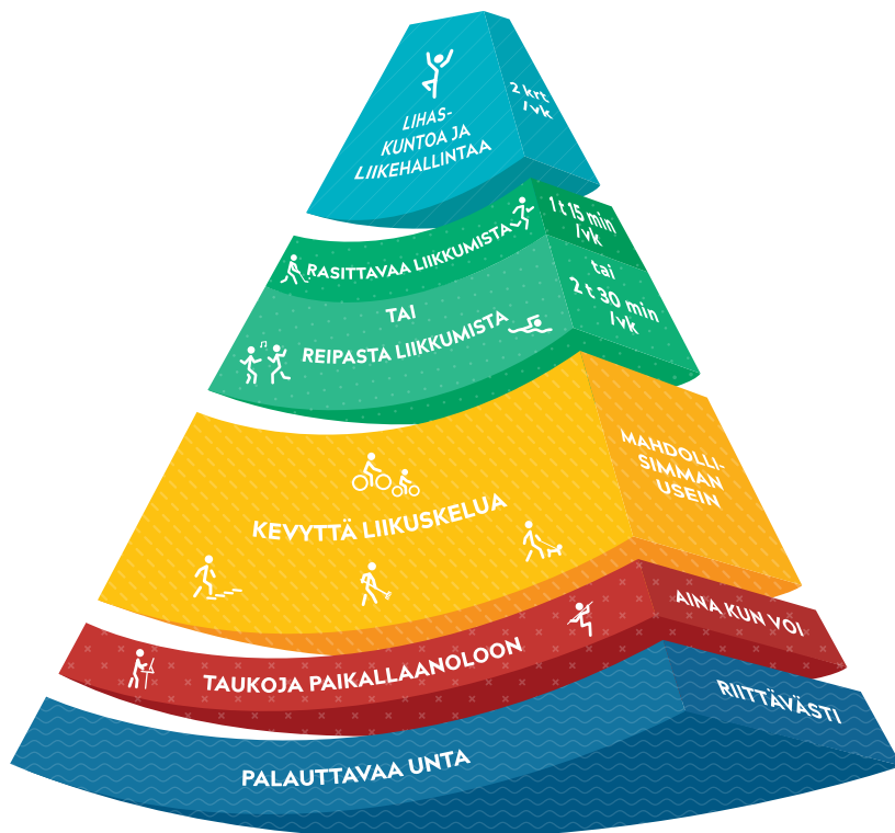
Kuva: Viikoittainen liikkumisen suositus 18–64-vuotiaille.

Viikoittainen liikkumisen suositus 18–64-vuotiaille kertoo terveyden kannalta riittävän viikoittaisen liikkumisen määrän ja antaa esimerkkejä liikkeen lisäämiseen arjessa. Suositus huomioi myös kevyen liikuskelun, paikallaanolon tauottamisen ja riittävän unen merkityksen. Sydämen sykettä kohottavaa liikettä eli reipasta liikettä suositellaan tehtäväksi 2 tuntia 30 minuuttia viikossa. Samat terveyshyödyt saa myös lisäämällä liikkumisen tehoa rasittavaksi. Tällöin liikkumisen määrä on 1 tunti 15 minuuttia viikossa. Lihaskuntoa ja liikehallintaa tulisi harjoittaa vähintään kaksi kertaa viikossa.