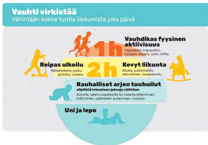
Kuva: Vauhti virkistää. Varhaisvuosien fyysisen aktiivisuuden suositukset 2016. Opetus- ja kulttuuriministeriö 2016: 21.

Alle 8-vuotiaiden lasten päivään pitäisi sisältyä vähintään kolme tuntia liikuntaa, joka koostuu kevyestä liikunnasta, reippaasta ulkoilusta sekä vauhdikkaasta fyysisestä aktiivisuudesta. Yli tunnin istumisjaksoja tulee välttää ja lyhyempiäkin paikallaanoloja tauottaa lapselle mielekkäällä tavalla. Lapselle tulee antaa mahdollisuus myös rentoutumiseen ja rauhoittumiseen.