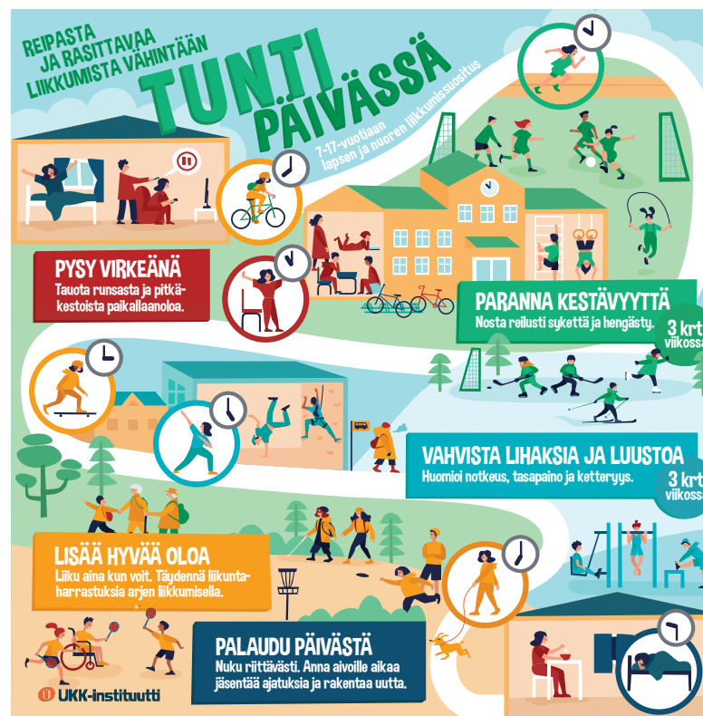
Kuva: Lasten ja nuorten liikkumisen suosituksen keskeiset viestit.

Kaikille 7–17-vuotiaille suositellaan monipuolista, reipasta ja rasittavaa liikuntaa vähintään 60 minuuttia päivässä kullekin sopivalla tavalla, ikä huomioiden. Runsasta ja pitkäkestoista paikallaanoloa tulee välttää.