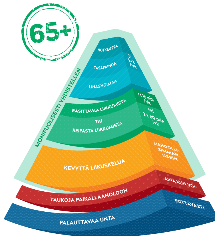
Kuva: Viikoittainen liikkumisen suositus yli 65-vuotiaille.

Viikoittainen liikkumisen suositus yli 65-vuotiaille tiivistää terveyden kannalta riittävän viikoittaisen liikkumisen määrän ja antaa esimerkkejä liikkeen lisäämiseen arjessa. Ikäihmisten suosituksessa painotetaan 18–64-vuotiaiden suosituksia enemmän lihasvoimaa ja tasapainoa, joilla on vaikutusta erityisesti arjessa selviytymiseen, liikkumiskykyyn sekä esimerkiksi kaatumisten ehkäisyyn. Suositus korostaa liikkumisen monipuolisuutta. Tavoitteena on toimintakykyä ylläpitävä tai parantava liikkuminen.