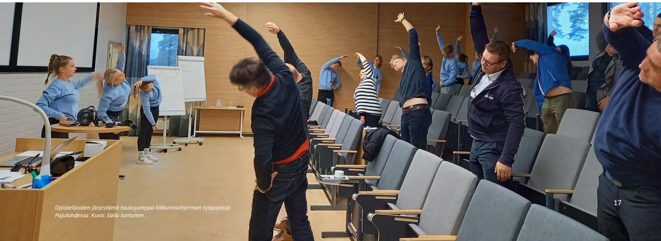
Opiskelijoiden järjestämä taukojumppa liikkumishjelman työpajassa Pajulahdessa.