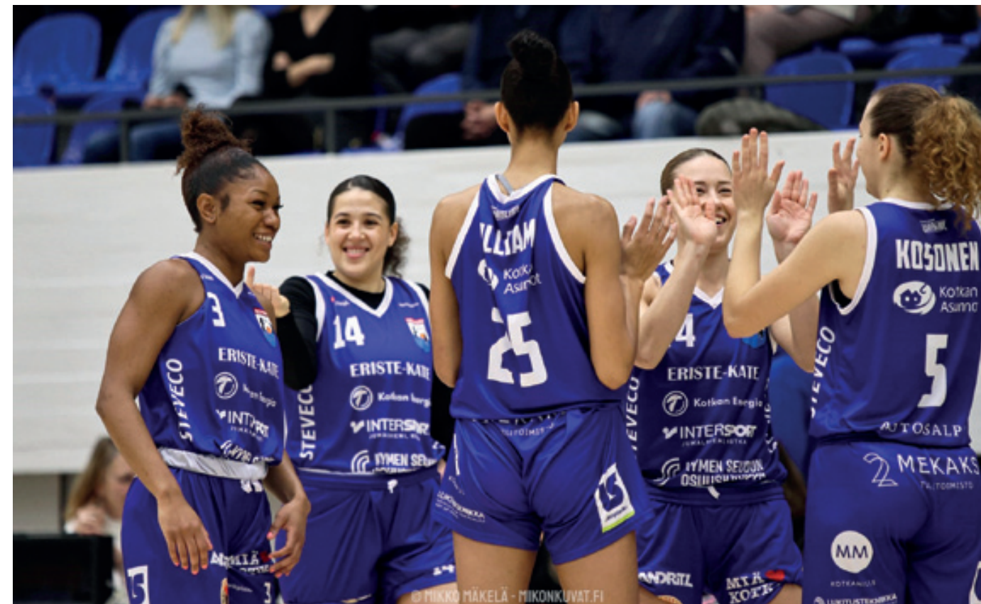
Joukkueessa on vahva tahtotila, jotta naisten Korisliigan mestaruuskannu löytäisi yhden väli vuoden jälkeen oikeaan osoitteeseen.

meellistä poukkoilua. Välillä pelataan ja välillä ei, Mäkelä harmittelee.