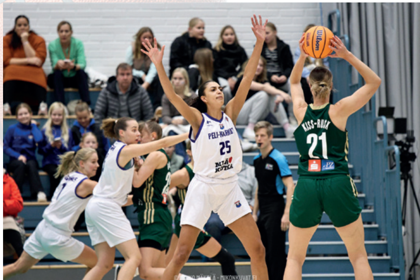
Peli-Karhujen osallistuminen maanosan toiseksi korkeimman tason kilpailuun EuroCupiin ei ollut hetken mielijohde. – Ajatus seuraavasta askeleesta kypsyi, kun voitimme viisi Suomen mestaruutta putkeen ja muutaman Cupin siinä sivussa.

– Saimme hyvää oppia, emmekä kadu osallistumista. Asiaa harkitaan, kun sen aika on. Tiedämme nyt, mitä se vaatii, Johansson toteaa.